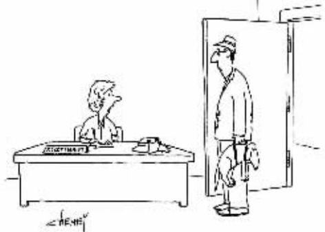
——你老婆来电话了,说你把公文包忘在狗食旁边了…… 采 尼

狗狗趣事,多少箩筐都装不下。有道是,彩虹尽头是乐土,有群狗狗在聚首;莫愁前路无知己,天下谁人不识君?有狗狗的日子真快乐。