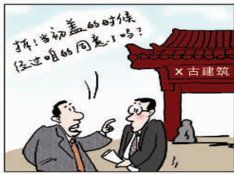
强词夺理 山东 于昌伟