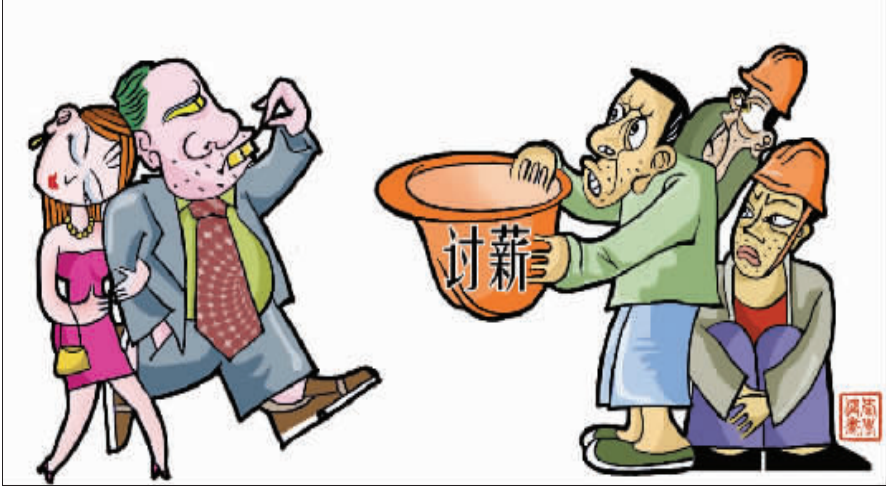
——我只不过暂时用你们的钱,包了点别的! 河北 张爱学