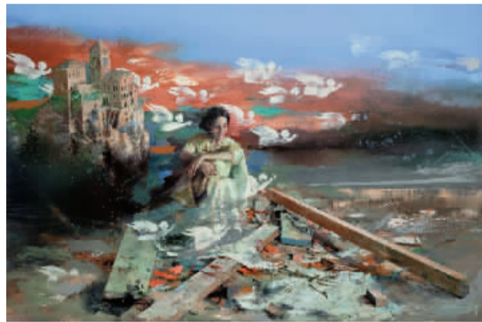
悲欣交集(综合材料) 瑞纳斯

品读瑞纳斯的作品后,许多读者会在心里留下那带有爱琴海独特味道和气质,仿佛看到一艘从古希腊艺术到当代希腊艺术的全息海船来到了中国。 源源