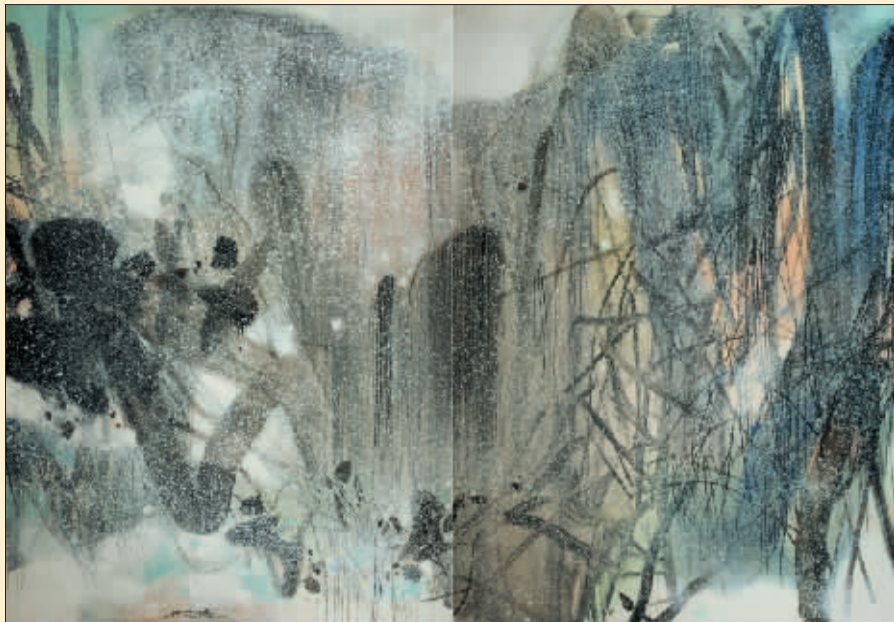
冬之灵感(油画) 朱德群

朱德群是法兰西学院200年来首位华裔院士和首位东方艺术家。正在中国美术馆展出的“朱德群回顾展”，清晰地呈现出他在不同历史时期的探索和艺术风格的演变过程。他将东方文化的思想观念、中国传统绘画的形式语言与西方抽象绘画的优长结合起来，形成了具有中国艺术精神和内涵的抽象风格。 源源