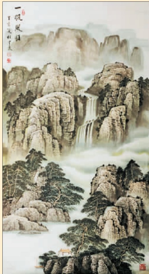
一帆风顺(国画) 杜中良