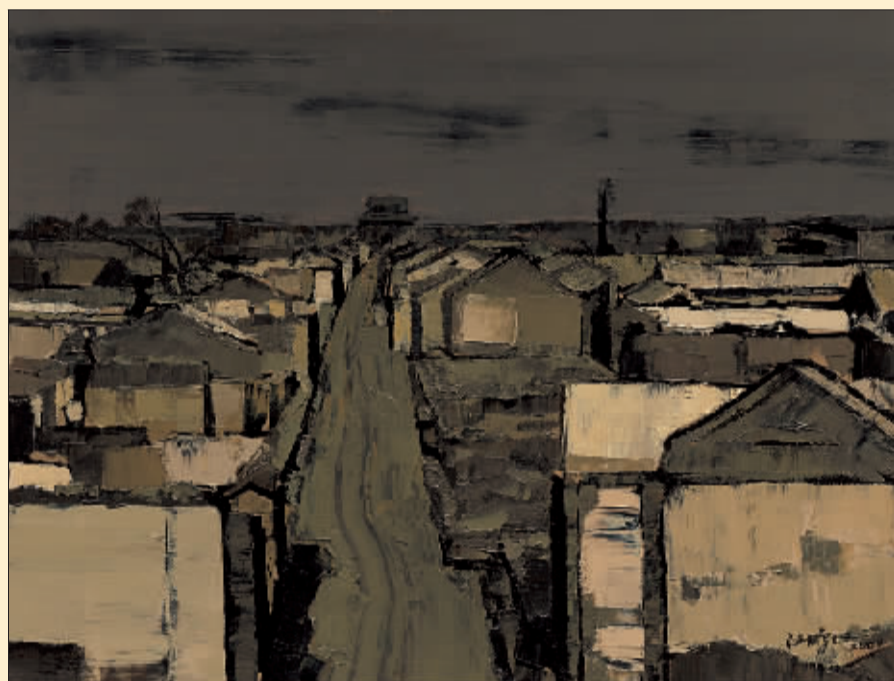
城之二(油画) 汪鹏飞

中国油画学会以“研究与超越”的学术精神为主旨举办此展,提倡和鼓励中国油画家积极探索,以真诚的心态,满怀激情地创作小幅油画。以简便、即兴的小幅油画的形式;拓宽观察视野,深入思考研究;以“所要者胆,可贵者魂”的艺术创造精神,努力超越自己。 法明