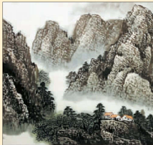
春意正浓(国画) 杜中良