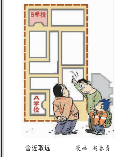
舍近取远 漫画 赵春青

近日,教育部下发《关于做好2016年城市义务教育招生入学工作的通知》中明确,要严控择校比例,实行就近入学,在择校冲动强烈的地方,要实行多校划片缓解择校热。这其实也是要切实落实“就近入学”。诚然,单靠推行“就近入学”,无法解决教育不公的问题,教育资源均衡才是王道。等到教育资源均衡达到一定程度,“就近入学”问题也就迎刃而解了。但最终解决教育资源均衡,谈何容易?这不是短时期内能够解决的,可“就近入学”却是一天都等不起的。划分区区,实行“就近入学”,任何时候都不能将民意排除在外。