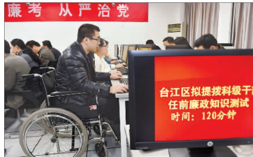
台江区拟提拔科级干部任前廉政知识测试时间:120分钟

“问题怎么解决,以后如何预防?相对于官员在电视上的对答如流,我们更希望他们在行动上能‘说干就干,干就干好’。”一位南宁市民表示。