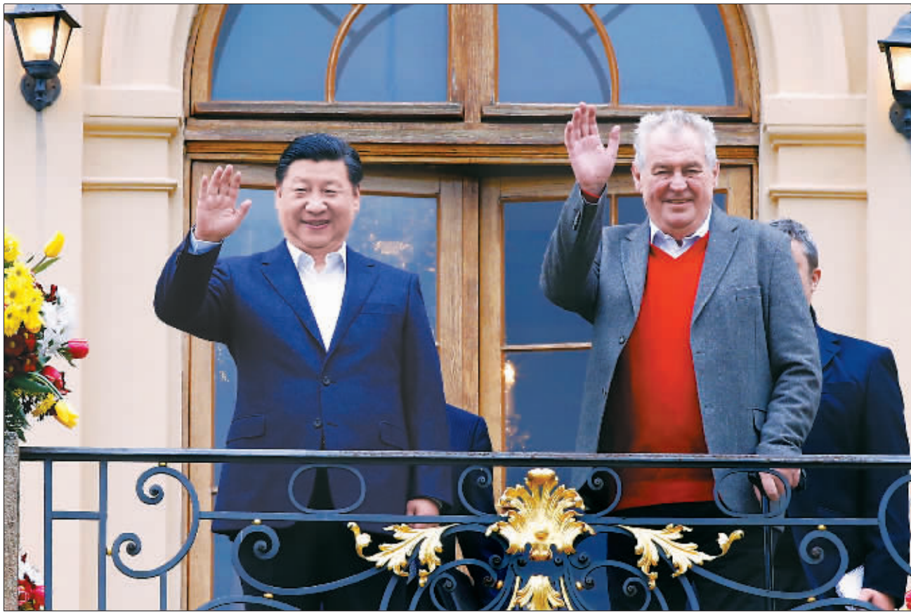
当地时间3月28日,国家主席习近平在布拉格拉尼庄园同捷克总统泽曼举行会晤。