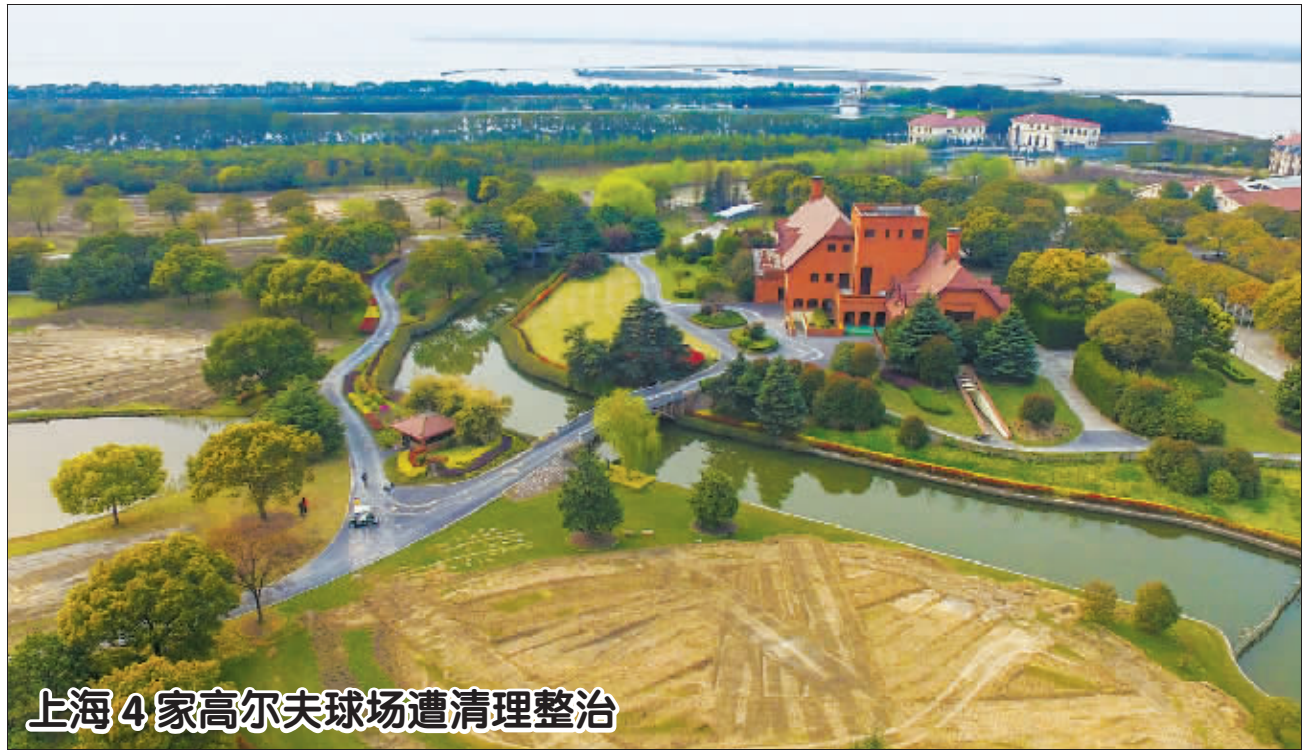
上海国际高尔夫乡村俱乐部的草坪已经被清理(3月26日摄)。近日,上海国际高尔夫乡村俱乐部、上海东方高尔夫俱乐部等4家毗邻饮用水源保护区的高尔夫球场相继被清理整治。目前,球洞、草坪、发球台等高尔夫球场特征均已被清除,相关会员、员工和企业投资方面的补偿正在加速进行。