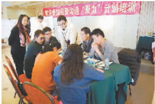
“聚力计划”培训现场。