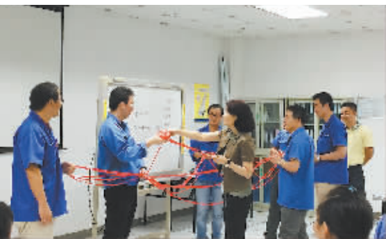
“聚力计划”来到富士电机企业返厂培训。