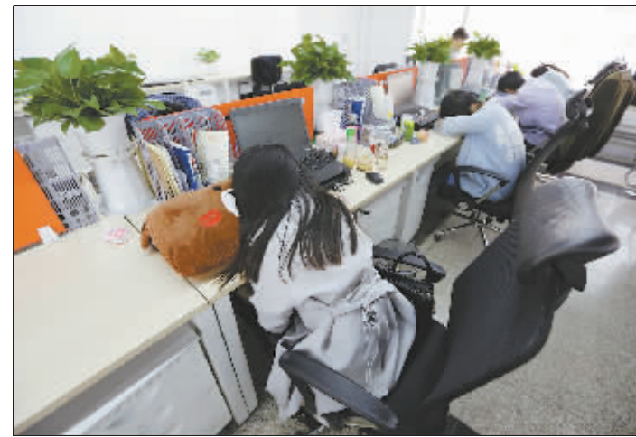
←4月21日,果仁宝公司的员工午饭在办公室座位上小憩。