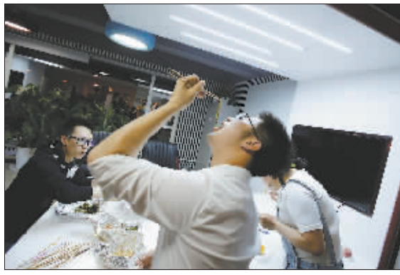
4月19日深夜,一家科技公司的员工在工作间隙吃宵夜。