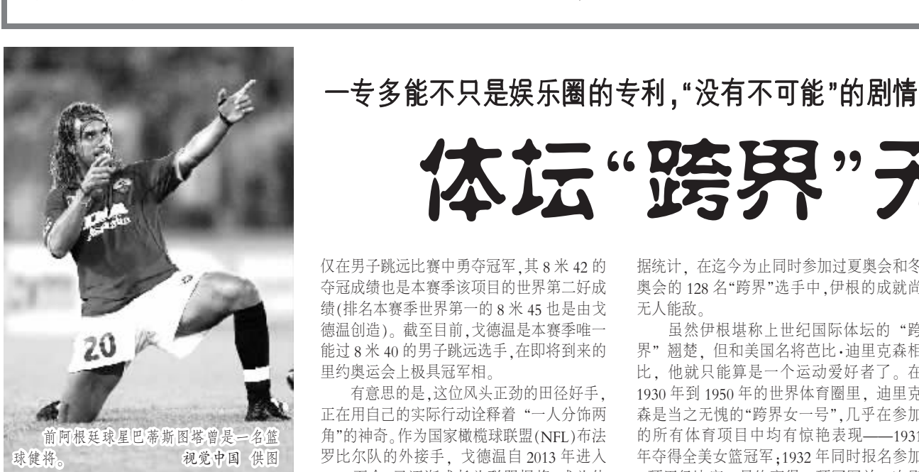
前阿根廷球星巴蒂斯图塔曾是一名足球健将。

处在费纳之争的年代,小德在2003年转入职业网坛以来,仅在2008年获得了一个澳网冠军。此后,他的成绩一直起伏不定。2011年,小德全面爆发,狂揽3个大满贯,只是没染病数量预计也会减少。