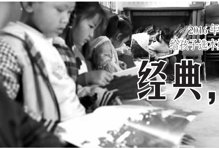
5月23日,贵州一所留守儿童爱心幼儿园里,孩子们在看一家阅读机构捐赠的经典儿童绘本。