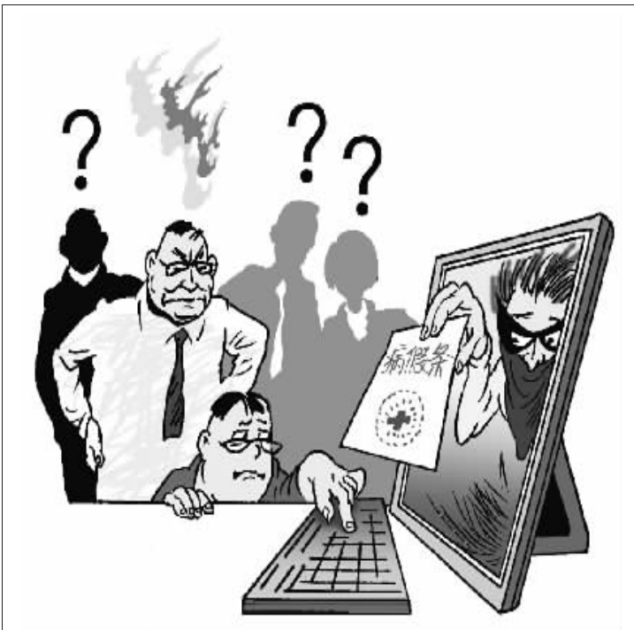
用假的病假条请病假，不是什么新招数，之所以一些人屡试不爽，实在是造假成本低，且大多数单位不会真的去医院核实。