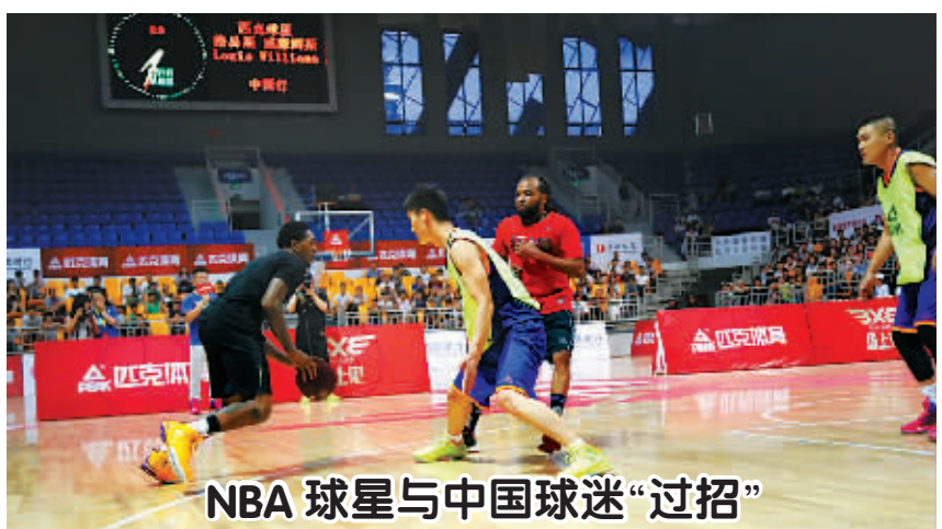
NBA 球星与中国球迷“过招”

本届比赛由国家体育总局汽车摩托车运动管理中心、青海省体育局和青海省海南藏族自治州共同主办，中国汽车摩托车运动联合会、共和县人民政府等单位承办。高原越野精英赛的营地按照国际化标准维修、餐饮、休闲、娱乐于一体，以便前来参加比赛的职业车手以及爱好者充分感受当地的民族文化、风土人情。