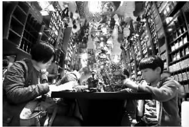
读者在钟书阁星光店里观看图书。

“加快推进城市实体书店创新发展,加大扶持乡镇实体书店建设力度”是《意见》的核心思想。《意见》指出,到2020年,要基本建立以大城市为中心、中小城市相配套、乡镇网点为延伸、贯通城乡的实体书店建设体系,形成大型书城、连锁书店、中小特色书店及社区便民书店、农村书店、校园书店等合理布局,协调发展的良性格局。要推动实体书店商业模式和服务形式创新,支