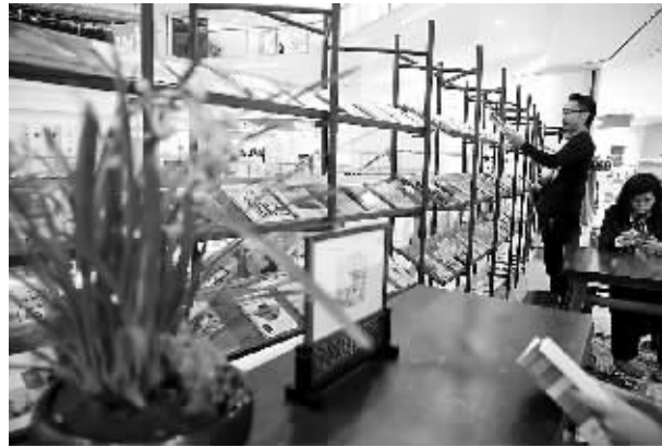
市民在浙江杭州晓风书展展区阅读。

持实体书店建设成为集阅读学习、展示交流、聚会休闲、创意生活等功能于一体的复合式文化场所,更加适应人民群众加速升级的文化消费需求。要推动实体书店与网络融合发展,充分利用互联网、物联网、云计算、大数据、数字印刷等新技术手段,实现由传统模式向新兴业态的转变,实现线上线下协同互动。