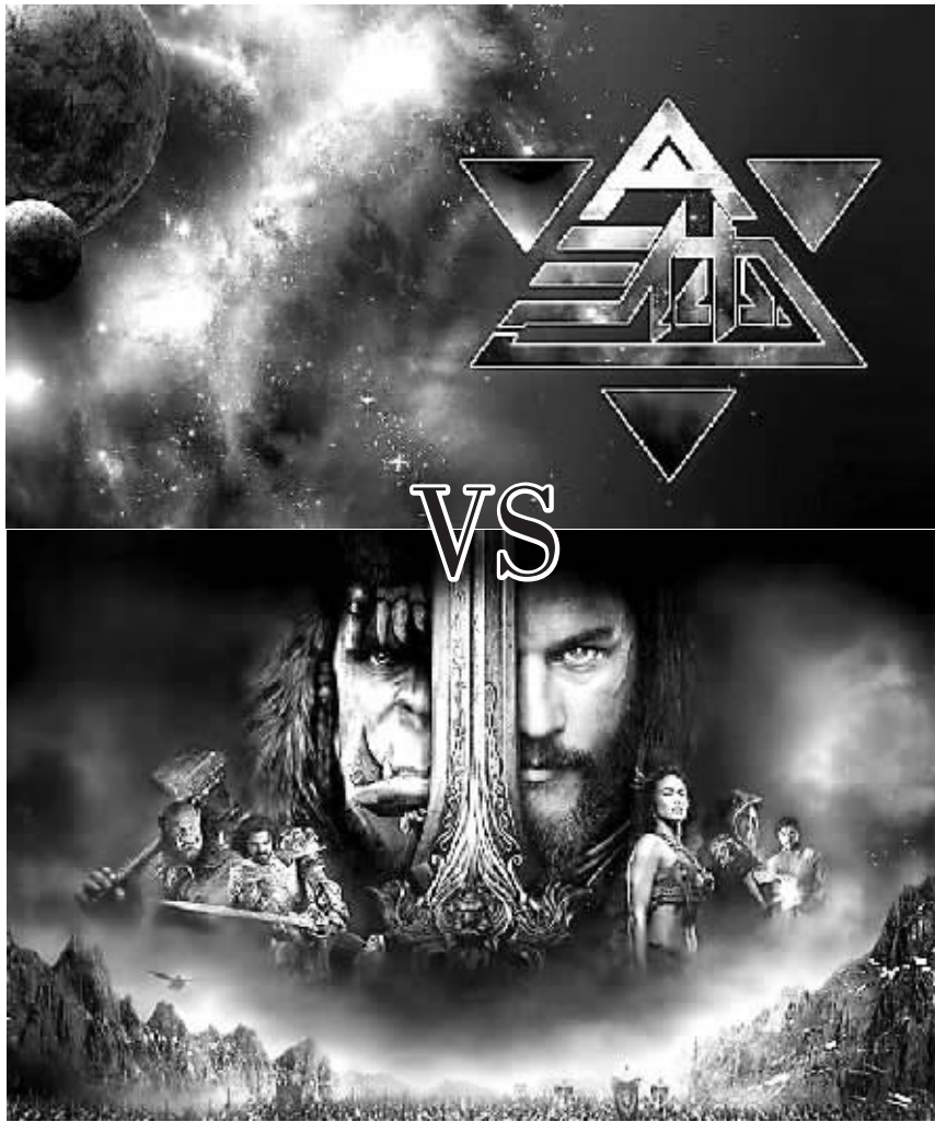
电影《三体》与《魔兽》剧照 资料图片

猜测与争论。“我不是很愿意和读者讨论已经发表过的作品。因为文学作品,包括科幻,是开放性的结构,它让读者有很多想象,而对问题固定答案就会堵住读者想象的路。所以小说作品写完,我不再过多涉