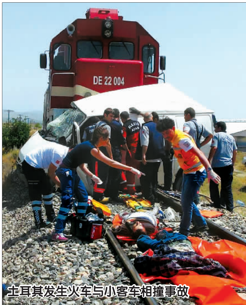
土耳其发生火车与小客车相撞事故

报告还说,全球国内流离失所者问题最为严重的3个国家是哥伦比亚、叙利亚和伊拉克,哥伦比亚因为冲突等原因流离失所者人数接近700万。