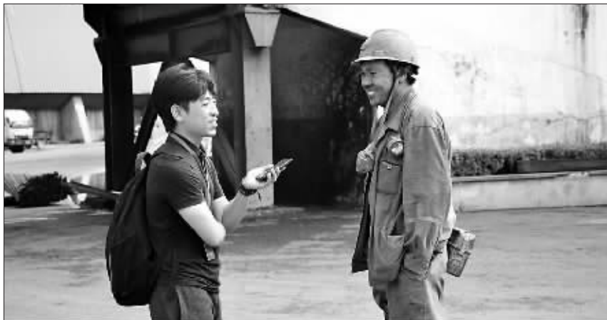
6月20日,由中国铁路、全国三教办组织的中央和行业类媒体编辑记者“延安行”活动正式启动。来自18家中央新闻单位、24家全国性行业类媒体的64名编辑记者,将利用一周时间在延安革命老区学习考察、体验生活,接受革命传统教育,提高做好新闻舆论工作的能力水平。23日,编辑记者们奔赴陕西黄陵二煤矿有限公司参观采访。图为《工人日报》记者采访煤矿职工。本报记者 窦海涛 兰德华 摄影报道