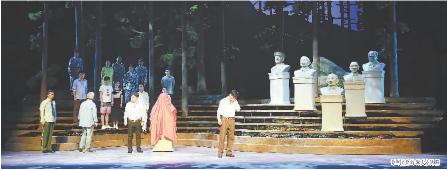
话剧《秦岭深处》剧照