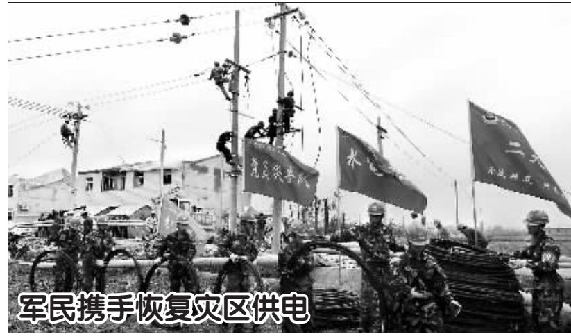
军民携手恢复灾区供电

中冒死冲锋,也需要有人在平凡的岗位上默默奉献。张思德就是这样一个无私的奉献者。在张思德的追悼会上,毛泽东同志亲笔题写了“向为人民利益而牺牲的张思德同志致敬”的挽词,并发表了《为人民服务》的演讲,高度评价了张思德完全、彻底为人民服务的崇高思想境界和革命精神。 1945年党的七大上,“中国共产党人必须具有全心全意为中国人民服务的精神”这句话被写入了党章。 从革命党到执政党,中国共产党自始至终坚持“全心全意为人民服务”的根本宗旨。 “为人民服务并没有‘过时’,仍然具有现实的指导意义,在改革开放和中国特色社会主义事业建设中,尤其需要坚持这种正确的价值导向。”延安大学中共党史研究院院长高尚斌教授认为,党和国家一切工作的出发点和落脚点都是最广大人民的根本利益,这是由“全心全意为人民服务”的根本宗旨决定的。 (新华社西安6月27日电)