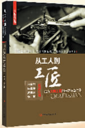
《从工人到工匠——成为大国工匠的自我重塑之路》