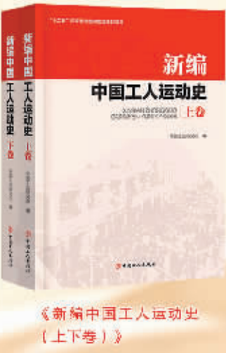
《新编中国工人运动史(上下卷)》