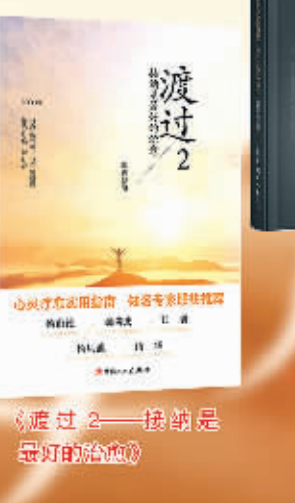
《渡过2——接着是最好的治疗》