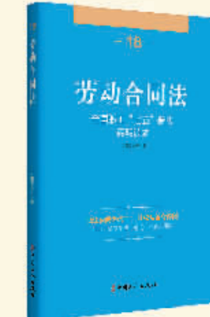
《全国职工“七五”普法简明读本丛书(全套共26册)》