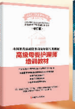
《高级母婴护理师培训教材(修订版)》