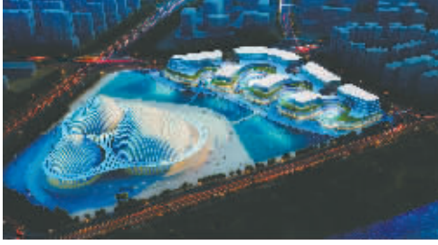
广西壮族自治区60周年大庆重大公益性项目——广西文化艺术中心