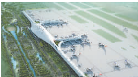
南宁吴圩国际机场T2航站楼以独特靓丽的形象被誉为广西“第一窗口、第一印象、第一形象”