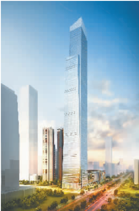
广西在建第一高楼——南宁华润中心东写字楼(445米)

近来,中建八局广西公司不断摸索创新投资模式,并以融投资带动施工总承包方式先后投资建设了一系列重点工程,南宁地铁2号线2个标段,南宁规划展示馆、展览馆,桂林大剧院、图书馆、博物馆,靖西至龙邦高速公路项目,桂林市重点工程国道321阳朔至桂林段扩建工程,广西体育中心配套市政路等项目,投资规模达500亿元,为广西建筑业注入了新的血液,助推了地方经济的发展。 首创“工友村”品牌 彰显央企风范 2015年10月,中建八局广西公司在广西文化艺术中心项目创建搭建了名为“工友村”的农民工宿舍区,在“工友村”可以在阅览室借阅书籍,活动室里下棋打牌,在安全讲堂内接受教育,开展职工沙龙活动……“工友村”从策划设计之初就想工友所想,超工友所想,与工会工作站网格化服务有机结合,统一设置超市、医务室、理发室、图书室、棋牌室、健身区等,提供免费剪发、义诊体检及送电影、安全教育等服务。村内无线网络全覆盖,床、空调、茶烟亭等生活设施一应俱全。村里设置夫妻房、洗澡房,安装空气能热水器,保证热水24小时供应充足;食堂宽敞、整洁、干净,菜式丰富可口。 工友村为务工人员提供了舒适的居住环境、便利的健身设施,良好的学习氛围,极大地丰富了工友的业余生活,改变了建筑行业卫生差、无秩序、难管理的生活区形象。经过不断总结经验,融入新的理念和思路,中建八局广西公司目前已建成15个工友村和25个工会工作站,不断丰富提升了工友村品牌。2016年12月1日,广西文化艺术中心项目工友村作为中华全国总工会为农民工服务工作暨推进户外劳动者站点建设现场经验交流观摩会的观摩点之一,迎来了有来自全国31个省、自治区工会主席,广西14个市总工会100多人的观摩团,全国总工会副主席、书记处书记焦开河对工友村称赞说道:“你们的工友村,为工会争了光,为国企争了光!”