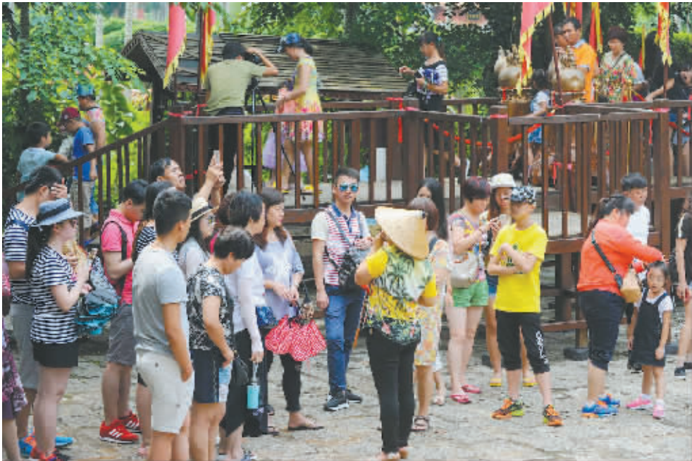
海南琼海全域旅游受欢迎。

游+”实践探索,通过跨产业融合、跨行业整合,拉长了产业链条,拓展了产业空间,创造了“1+1>2”的价值,有效推动全域旅游“落地开花”,很大程度上提高了旅游在经济社会发展中的贡献度。 “我们正在从封闭的旅游自循环,向开放的‘旅游+’融合发展方式转变。”国家旅游局相关负责人表示,“旅游+”新业态既为旅游业自身发展拓展了广阔空间,也为带动其他产业发展提供了巨大动能;既为旅游业自身的转型升级挖掘了潜力,也为整个经济结构调整注入了活力。 而目前,全国范围内,全域旅游可谓“好戏连台”。浙江、江苏、湖南、山东、河南等地区内的国家首批全域旅游示范区创建点,正积极进行资源整合,致力于打造全域旅游样本,纷纷拉开全域旅游大幕。 全域旅游所追求的,不再是停留在旅游人次的增长上,而是旅游质量的提升,追求的是旅游对人们