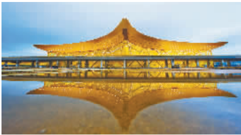
国内最大的单体航站楼——昆明长水国际机场荣获鲁班奖、詹天佑大奖、国优金奖3项大奖