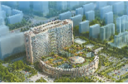
广西壮族自治区60周年大庆重大公益性项目——广西国际壮医医院