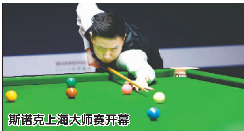
斯诺克上海大师赛开幕

球时代较中国队更善于相持。另外,今年以来教练的更替可能也给男乒的成绩带来一定的影响。今年3月,国乒男队教练组完成竞聘,教练组的人员进行了更换,多位年轻教练开始执教,除了两次带队参加奥运会的秦志戩担任男队主教练外,教练组其他5位教练——刘国正、王皓、马琳、刘恒、马俊峰都未有带队出征奥运的经历。