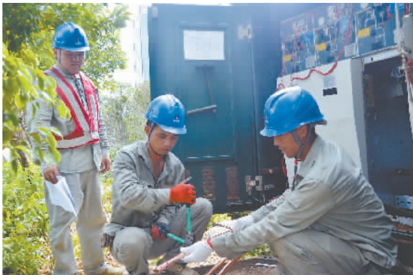
为光明港水系治理工程新装箱式变压器

10月10日,福州市晋安区新店镇秀峰路东园村新店片区水系综合治理解放溪电力管线迁改工程圆满完成。这是自年初水系治理工程启动以来,国家电网福州供电公司完成的第四项电力管线迁改工程。