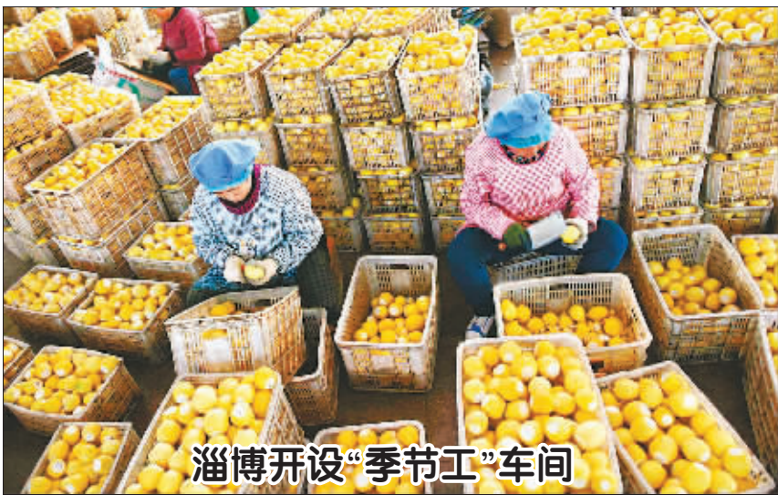
淄博开设“季节工”车间

11月15日,农民在山东省淄博市沂源县悦庄镇一果品加工企业分拣准备加工果脯的果品。