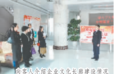
向客人介绍企业文化长廊建设情况

年度计划管理。今年1-10月份,该公司党委开展中心组集中学习10次,19个党支部共开展集中学习190次,全体249名党员自学覆盖率100%。党委7名成员分别到所在支部讲党课16次,邀请县委党校讲师集中讲党课2次,组织收听上级公司党课2次。组织“两学一做”学习教育及党建知识竞赛1次。 全面加强组织建设和党风廉政建设。 宁城县供电公司党委结合“基层组织建设年”工作,在建设廉洁性、服务性、规范性党组织上下功夫。成立示范点并全面推广。推动公司建成市公司级1个标准化党支部示范点,同时全面推进其他基层标准化党支部。从组织机构建设、制度建设、阵地建设、规范组织生活、严格档案资料5大方面进行建设管理。规范基层党组织机构。积极开展党支部换届活动,根据党章要求对不足3名党员的支部进行了合并,方便了党支部组织生活,提高了工作效率。各党支部在原有的组织委员、宣传委员的基础上,设兼职纪律委员,列出支部委员责任清单;严格执行党支部书记岗位设置、岗位职责、职数职级和任职资格,坚持把最优秀的党员选拔到党支部书记岗位。