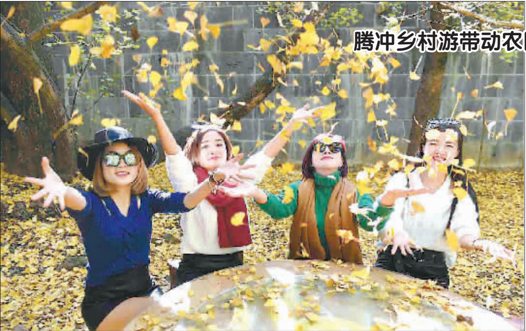
腾冲乡村旅游带动农民增收致富

刘士余表示,证监会已经决定成立发行与并购重组审核委员会,对首次公开发行、再融资、并购重组实行全方位的监察,对发审委和委员的履职行为进行360度评价。“坚持无禁区、全覆盖、零容忍、终身追责。”刘士余的讲话中也透露出了必须严把上市公司质量关的信息。他强调,“要坚决落实依法全面从严的监管理念,严格专业履职、依法审核,防止问题企业带病申报、蒙混过关。”