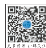
更多精彩内容扫码关注