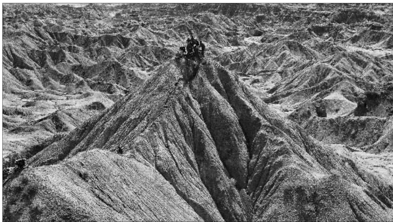
塔里木的石油工人 2009年3月,中国石油勘探队的队员们在新疆塔里木地区进行油气勘探作业。

2017年10月31日至12月15日,《于心无悔》于文国摄影作品展在中国摄影展览馆举办。本版照片选自本次展览部分作品。