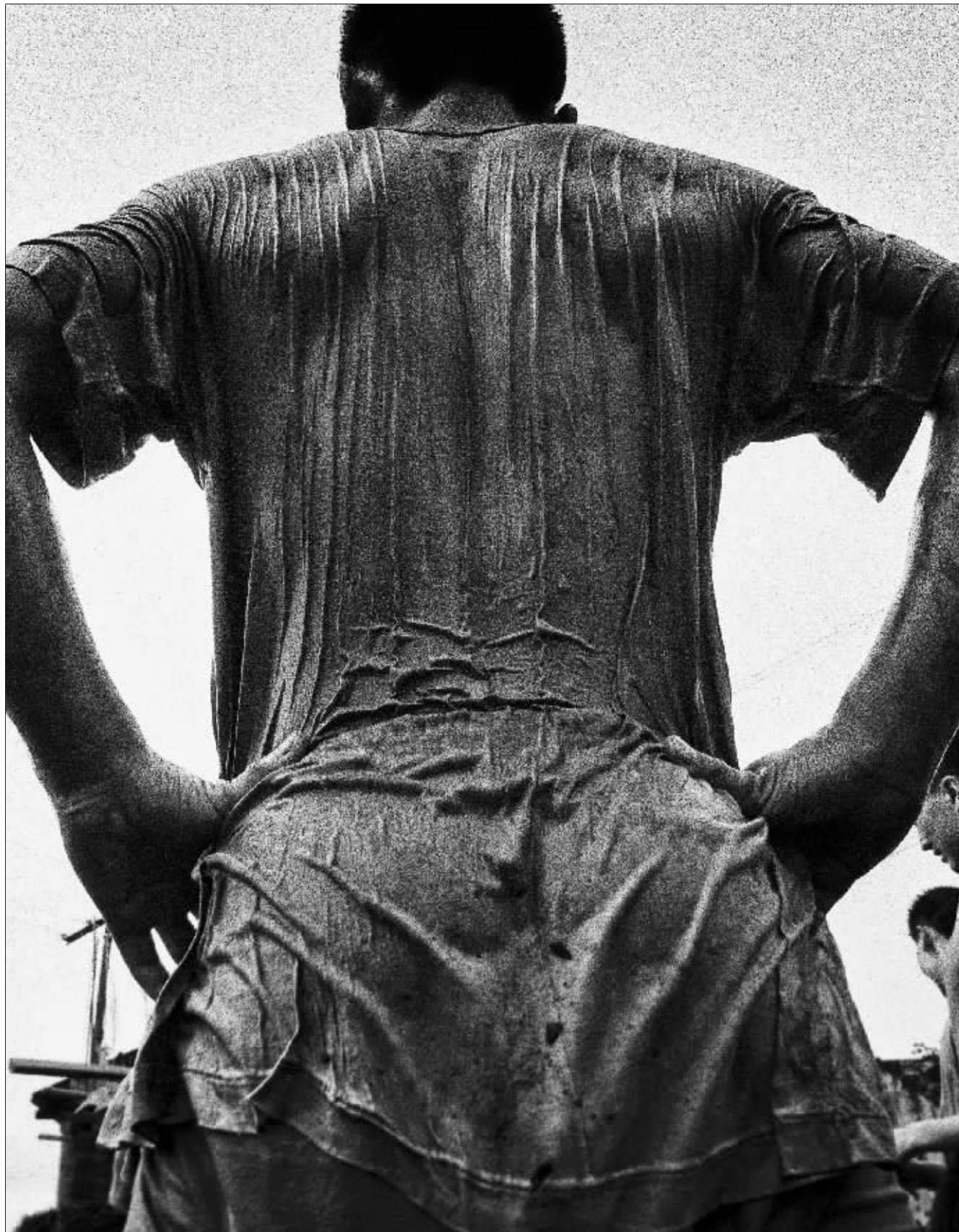
脊梁 1998年7月30日,江西省九江市永修县郭东大堤上,武警战士与洪水搏斗两小时之后。当年,我国长江、嫩江等流域发生特大洪水。

1992年9月,在青藏公路海拔4800米的一处工棚里,一位因高原病而奄奄一息的护路工。