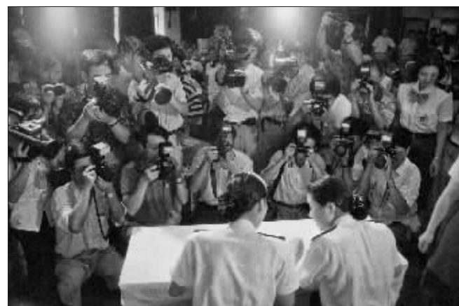
纺织女工变空姐 1995年1月,上海虹桥机场。18名纺织女工从5万人的选拔中脱颖而出,培训后成为空姐,准备登机。