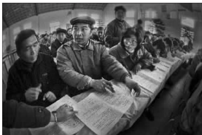
端掉“铁饭碗” 1992年3月,上海柴油机厂劳动合同大会,从此,全厂职工由固定工改为合同工,被端掉了“铁饭碗”。