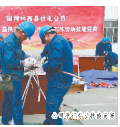
公司举行劳动技能竞赛

和学习内容以里程碑计划的形式下发，以弥补青年职工在发展过程中的短板。倾力支持青年职工对口援助供电所、为青年职工成长提供发展机会和学习平台，给青年职工成长提供空间。青年职工每月在供电所的4天时间内，其身份为供电所职工，由供电所进行管理和考核，供电所根据援助人员所从事专业，为其安排援助岗位。明确其在基层从事运维检修、安全管理、营销服务及农网改造等具体业务，使青年职工能真正发挥作用，得到实践锻炼机会。常态化制度化开展“青年讲堂”活动，本着“实际、实效、实用”的原则，围绕公司中心工作，从青年职工成长成才和能力素质提升等方面开展。2017年，举办青年讲堂9期，共计参与人数348人次。青年讲堂主要内容涵盖专业知识、心理疏导、党员对标、学习工匠精神、志愿服务等内容。把一线师傅请上讲台，讲解线路架设、装表接电等实用技术，现场操作演示，培养青年职工的业务技能；同样，把党员标杆、劳动模范请上讲台，同时，也号召青年职工自己走上讲台。从活动成效上看，青年讲堂已成为青年职工学习交流、推进业务、提升素质的平台。