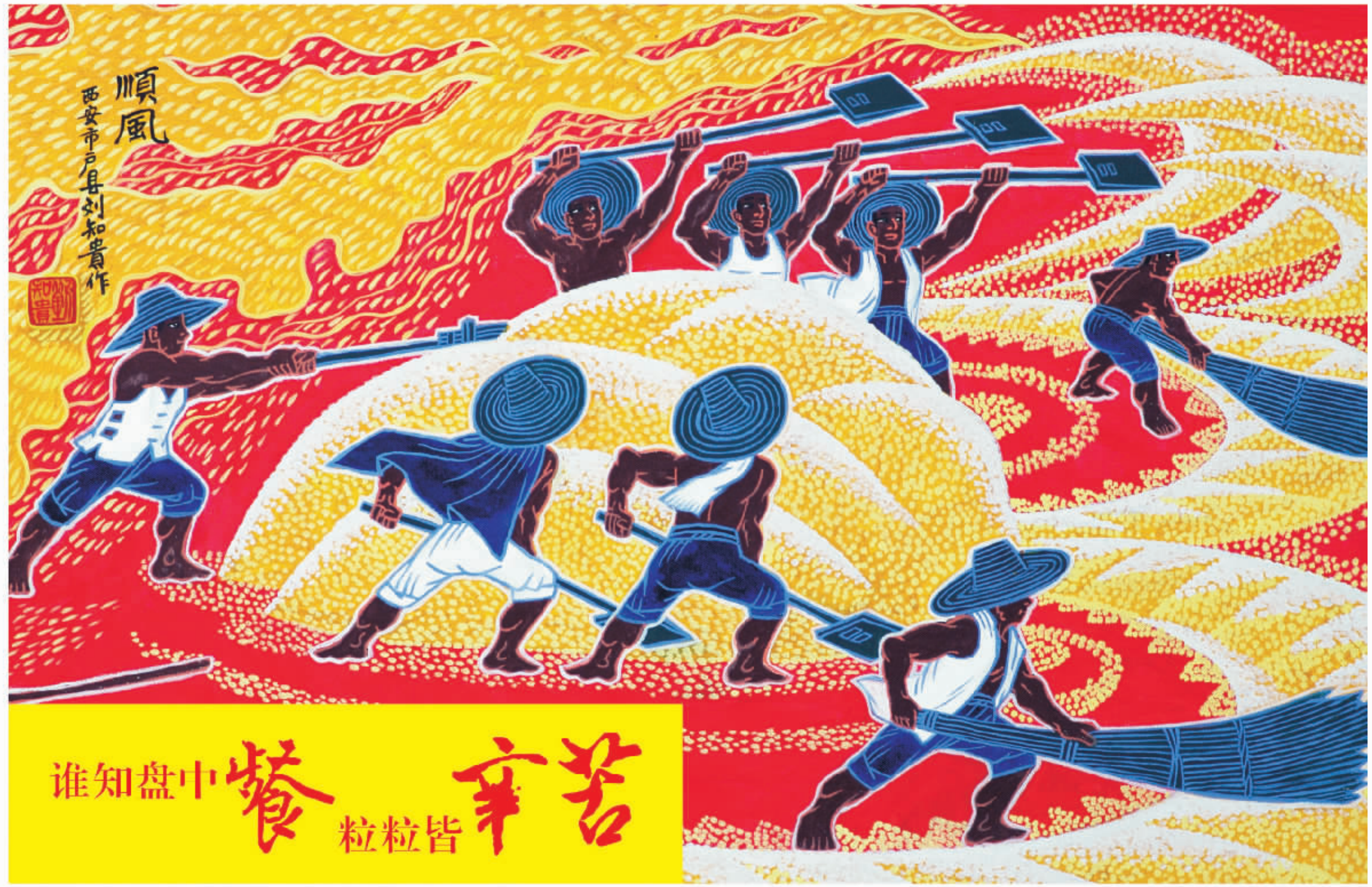
作者：陕西省户县刘知贵