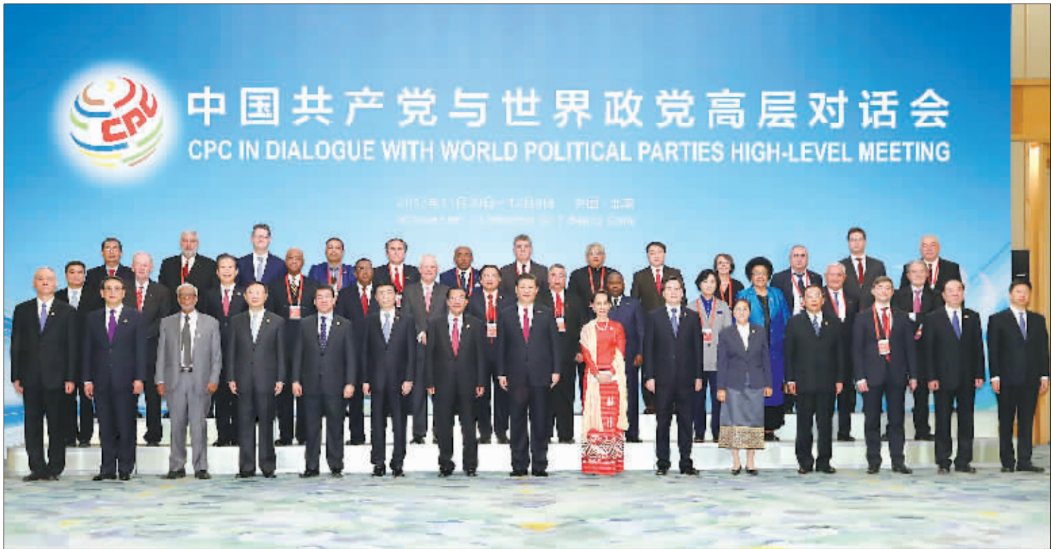
12月1日,中共中央总书记、国家主席习近平在北京人民大会堂出席中国共产党与世界政党高层对话会开幕式,并发表题为《携手建设更加美好的世界》的主旨讲话。这是开幕式前,习近平与外方主要嘉宾合影留念。

新华社北京12月1日电(记者崔文毅、许可)中共中央总书记、国家主席习近平1日在人民大会堂出席中国共产党与世界政党高层对话会开幕式,并发表题为《携手建设更加美好的世界》的主旨讲话,强调政党要顺应时代发展潮流,把握人类进步大势,顺应人民共同期待,志存高远,敢于担当,自觉担负起时代使命。中国共产党将一如既往为世界和平安宁、共同发展、文明交流互鉴作贡献。 习近平指出,中共十九大规划了中国从现在到本世纪中叶的发展蓝图,宣示了中方愿同各方推动构建人类命运共同体的真诚愿望。政党在国家政治生活中发挥着重要作用,也是推动人类文明进步的重要力量。年终岁末,来自世界各国近300个政党和政治组织的领导人齐聚北京,共商合作大计,充分体现了大家对人类发展和世界前途的关心。 习近平指出,今天人类生活的关联前所未有,同时人类面临的全球性问题也前所未有。