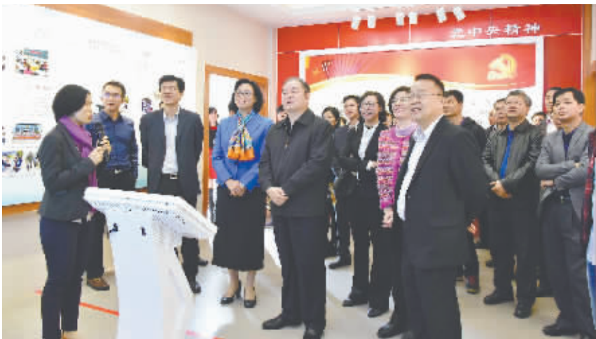
广东省人大常委会副主任、省总工会主席黄业斌(左五)带领广东各地工会领导干部参观南区党群活动服务大楼

训、走访基层、开展活动等多种方式,强化示范点工联会凝聚服务辖区企业工会和职工群众的作用。一方面,镇区工委加强指导,另一方面,示范点社区(村)工联会建立健全工会干部联系企业职工制度,坚持每周不少于2次走访企业、每月组织1次职工活动,每季开展1次劳动关系状况和职工思想动态调查分析,每年进行1次以上职工服务需求和工会工作调研,推动工会组建、工资集体协商等重点 works 落实。