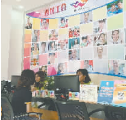
西区职工服务中心选址在非公企业集中的社区工联会,方便职工上门活动服务

做好“三个一批”建设,争取党政支持是前提,健全工会组织是基础,落实人员经费是保障,做优职工服务是关键。中山市总工会将以党的十九大精神为指引,用习近平新时代中国特色社会主义思想武装头脑,指导改革实践,继续深入贯彻落实省总和市委工作要求,学习借鉴各市先进经验,增强职工群众工作本领,创新职工群众工作体制机制和方式方法,充分发挥工会为党联系群众的桥梁和纽带作用,切实担当好引导职工群众听党话、跟党走的政治责任。