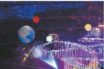
11月2日,首届世界无人机锦标赛开幕式在深圳大运中心举行。开幕式上的文艺表演。

电子竞技到底是不是一项运动,至今仍然存在很大争议。根本原因是电竞的运动属性并不充足。但脱胎于航模的无人机竞赛,却无疑是一项体育运动。 相比纯粹存在于虚拟的电竞,无人机运动的本质区别是在现实空间拥有一个“实物”。有实物就要有标准,就像球类运动规定了球的尺寸和重量。国际航空运动联合会对于参加竞速的无人机标准是:对角线不超过33厘米,重量不超过一公斤。 不过,在不少业内人士看来,这样的标准还不能满足无人机竞赛性和观赏性的要求。至少从现场和视频直播来看,目前无人机竞速赛的观众体验并不令人满意。