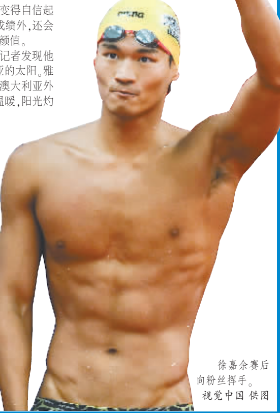
徐嘉余赛后向粉丝挥手。

慧并没能青出于蓝而胜于蓝。“她有任何需要帮助的,我都有求必应,我也希望她变得更好,但这个东西(转身技术)我只能说自己的心得,真正领悟的还是她自己。”