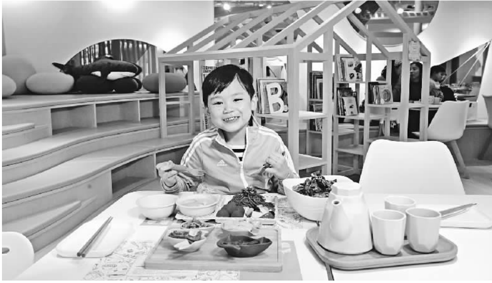
“亲子餐厅”“儿童套餐”受到小朋友的喜爱。

“我们想站在孩子的角度,以动画的形式将菜单一一呈现,来抓住儿童的兴趣点。借这样的点餐方式在点燃孩子们的兴奋点的同时,让他们对自身所