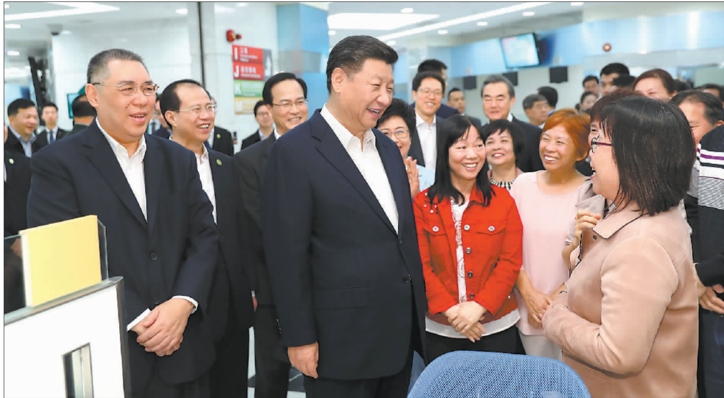
12月19日,国家主席习近平在澳门黑沙环政府综合服务中心同澳门市民亲切交流。