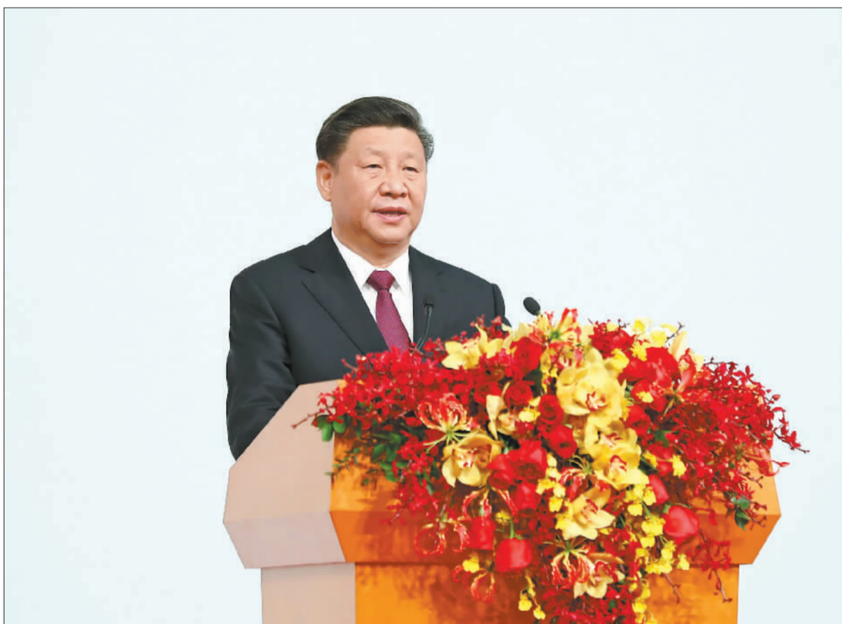
中共中央总书记、国家主席、中央军委主席习近平发表重要讲话。

习近平指出，澳门回归祖国20年来，澳门特别行政区政府和社会各界人士同心协力，开创了澳门历史上最好的发展局面，谱写了具有澳门特色的“一国两制”成功实践的华彩篇章。希望澳门特别行政区新一届政府和社会各界人士站高望远、居安思危，守正创新、务实有为，在已有成就的基础上推动澳门特别行政区各项建设事业跃上新台阶。