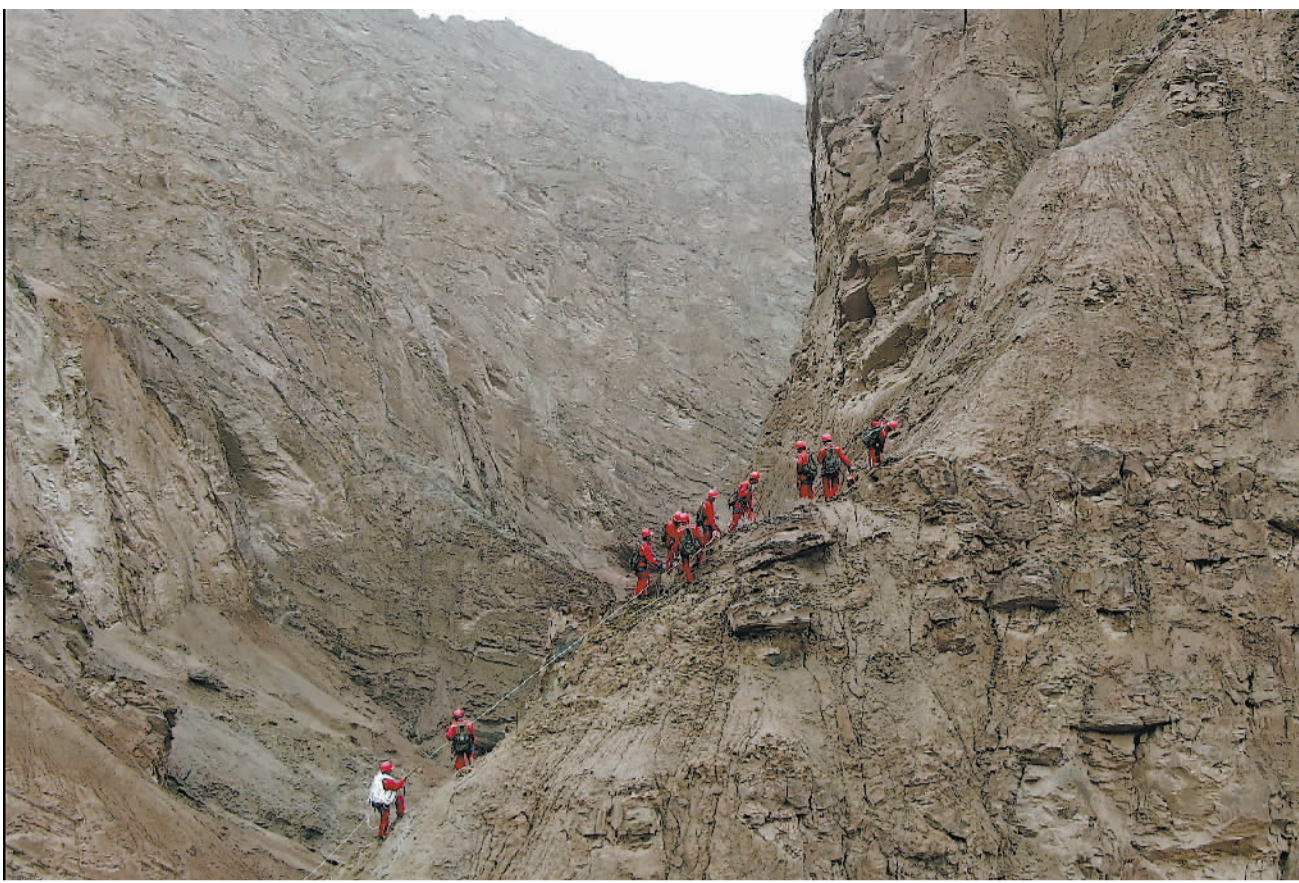
6月12日,新疆秋里塔格地区,物探工人们正在一处山梁上铺设测线,这是寻找油气中的一项基础工程。