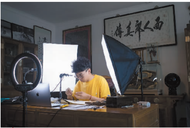
8月16日,面人即第三代传承人即佳子或正在工作室捏网红卡通形象,并录制抖音。工作室陈列着即家三代人上万件作品。