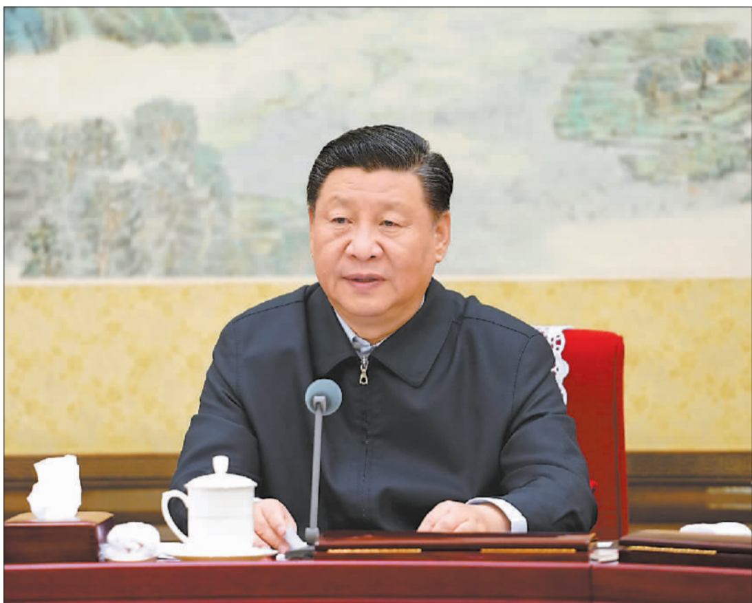
中共中央总书记习近平主持会议并发表重要讲话。