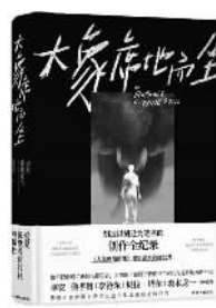
胡迁 著 译林出版社

拍电影时,他叫胡波;写小说时,他叫胡迁。这两个身份如同两条平行线,一直贯穿其创作生涯,构造了两条独具魅力的创作轨迹,直到在电影《大象席地而坐》中交叠重合。本书完整收录了这部非凡遗作的电影拍摄剧本,从中可以看到胡迁对文学语言和影像语言敏锐的感知力和表现力。书中还收录了胡迁完成于2011年却从未发表过的长篇小说《小区》:小区的下水道污水横流,住在三单元的女人赵淑被杀,车棚管理员黄枪被当成了替罪羊,他不得不开始关注小区的变化,并慢慢发现了藏在每个住户身上的秘密……正是这部小说开启了胡迁的文学创作之路,犀利的社会洞察、别具匠心的文本结构和叙事手法都呈现出高度浓缩的戏剧张力。