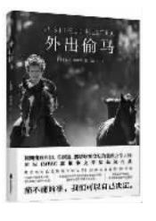
[挪威] 佩尔·帕特森 著 余国芳译 北京联合出版有限公司

痛失所爱的传德,失去了与人对话的兴趣,一个人,带着一只狗,来到挪威边境的一座森林木屋。他打算把过去抛得远远的,平静地在这里度过余生。一次与邻人的偶遇,却又不费吹灰之力让他回想起15岁那年和父亲一起在山林中度过的夏天。这是传德始终不愿意回想和面对的回。就在那年夏天,他永远地失去了和自己一道去冒险偷马的好朋友约恩,再也没有见到过父亲,而他余生的命运也由此被永远注定。这个充满寂静和惆怅氛围的动人故事,既是传德的,也包含着每个人必定从岁月里尝到的滋味。生活可以打击你,命运可以捉弄你,但不要走出来,你可以自己决定。(晓阳)