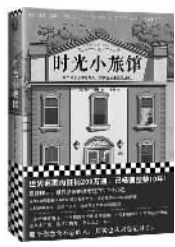
[美] 杰米·福特 著 郭莉译 上海文艺出版社

美国西雅图,唐人街与日本城交界处,有一座关闭三十六年之久的古建筑,狭窄的双扇门上写着“巴拿马旅馆”。四十多年前,这座旅馆曾见证了亨利一生甜蜜与悲苦的时光。四十多年后的今天,旅馆重新开业,人们意外发现地下室里藏有三十七个日裔家庭的行李。偶然经过旅馆的亨利发现,行李中竟然有他熟悉的旧物——一把绘有鲤鲤的日式纸伞。尘封多时的记忆瞬间被唤醒:碎裂的老唱片、飘落的樱花、残酷的集中营,还有一个忽然离去的女孩。这么多年,他从未真正忘记那个女孩。她在哪里?她是否也在等着他? 杰米·福特是美国著名华裔作家,本书是其长篇小说处女作。