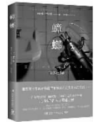
[挪威] 尤·奈斯博 著 谢孟蓉译 湖南文艺出版社