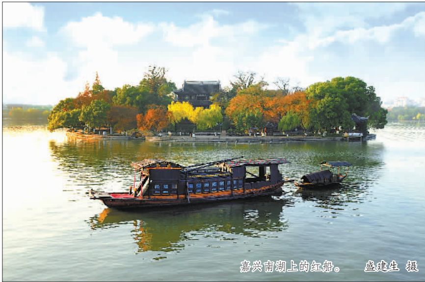
嘉兴南湖上的红船。

作为党的诞生地，如今的嘉兴提出打造“重要窗口”中最精彩板块，着力提高人民幸福生活含金量。 决策者希望，嘉兴发展的万家灯火里，闪耀着老百姓的富足与安康：让人民有更好的教育、更稳定的工作、更满意的收入，更可靠的社会保障、更高水平的医疗卫生服务、更舒适的居住条件、更优美的环境。 2020年开局艰难，但在嘉兴城市里生活着的最柔弱的人群，也在民生实事的托举下，生活发生了天翻地覆的变化。仅仅用了10个月，就让市区1637户住房困难居民彻底告别了“拎马桶”“筒子楼”生活；大年堂这块18年没能啃下的“硬骨头”，终于在居民、社会、政府三方满意的笑声中尘埃落定；“城中村”的拆迁，“断头河”的贯通，老旧小区和背街小巷的系统提升，“不城驿·温暖嘉”“幸福里”菜场与市民见面，也都顺利完成。