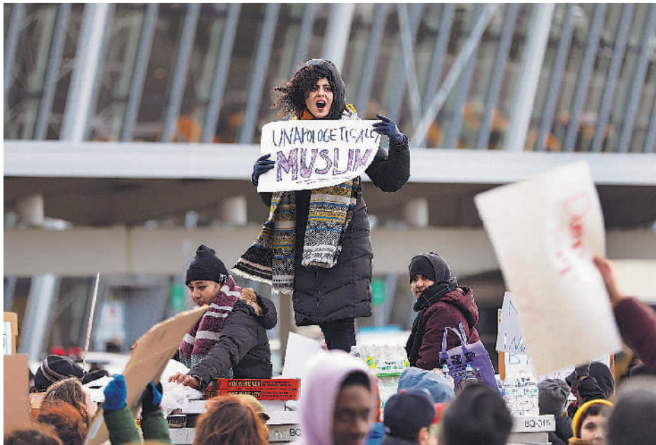
2017年1月29日,示威者在美国纽约肯尼迪机场集会,抗议美国针对穆斯林群体颁布的禁令。一项民调显示,80%以上的美国受访者认为,穆斯林在美国受歧视。