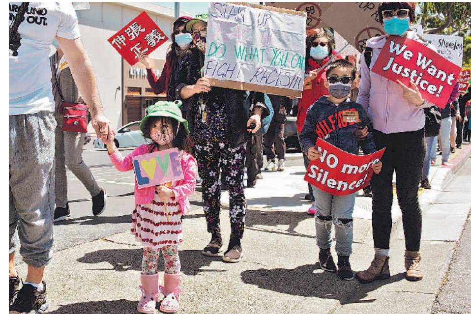
4月17日,人们在美国加利福尼亚州米尔布雷参加集会,抗议针对亚裔的歧视行为和仇恨犯罪。