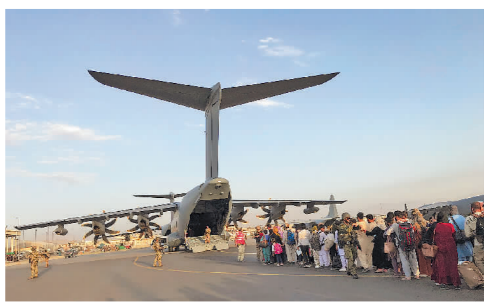
8月24日,人们在喀布尔国际机场排队等候乘坐德国军用飞机离开。