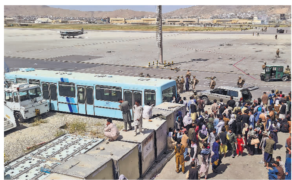
大批阿富汗民众在喀布尔机场外焦急等待。