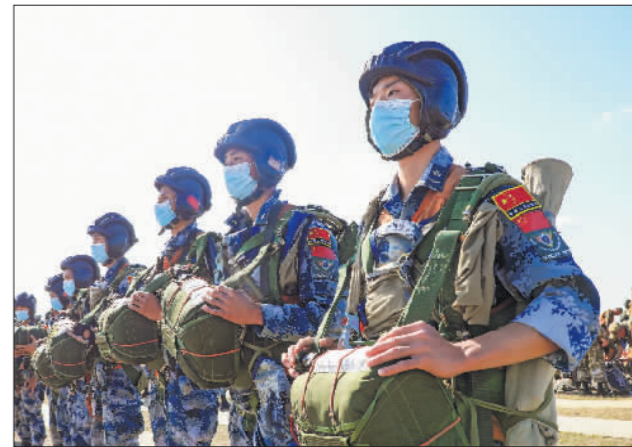
“国际军事比赛-2021”“空降排”项目