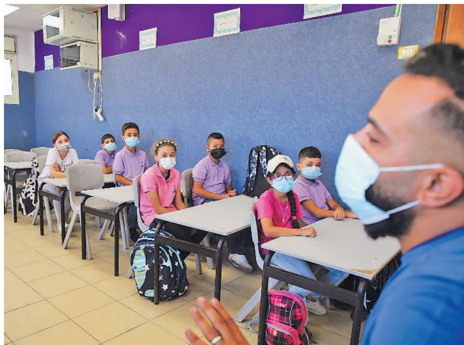
9月1日,耶路撒冷一所小学的师生在开学第一天上课。