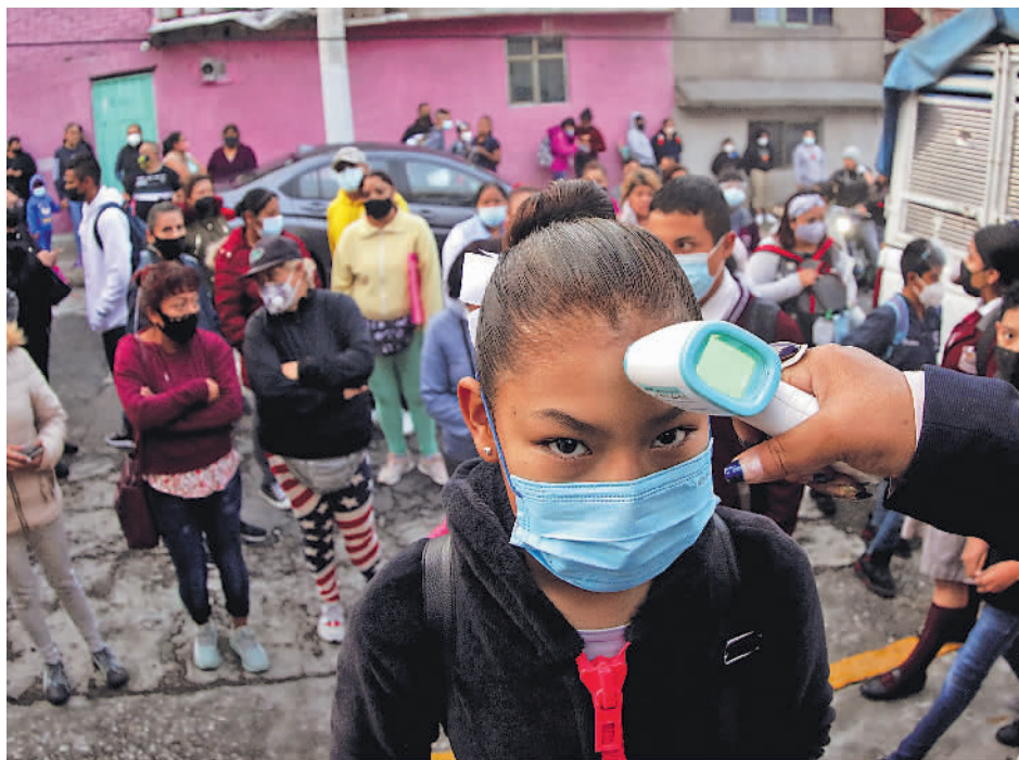
8月30日,在墨西哥特拉内潘特拉,学生进入学校前接受体温检测。