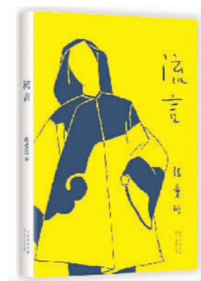
《流言》 张爱玲 著 北京十月文艺出版社