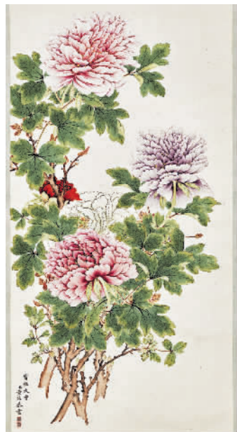
《宝槛天香》 董浩(清)