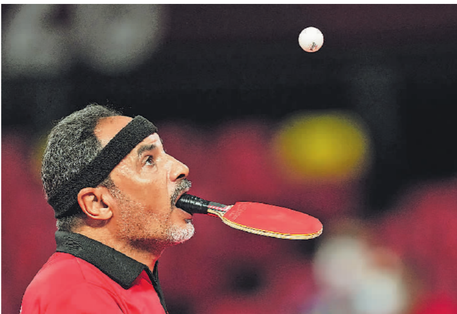
8月27日，埃及选手易卜拉欣·哈马托在东京残奥会乒乓球小组赛发球。

感谢残奥会，感谢“不可能先生”，让我们看到了人类无尽的潜能，也感受到了人之所以为人的尊严和高贵。