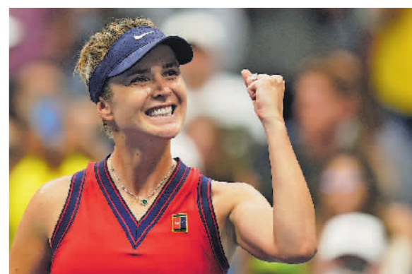
9月5日，在2021年美国网球公开赛女单第四轮比赛中，乌克兰选手斯维托丽娜以2比0战胜对手，晋级八强。

据悉，茵浪体育是国内首家专注于足球及其相关产品的研发、生产和销售的民族品牌。近年来，茵浪全面发力国内各级别足球赛事，热心足球公益活动。关爱儿童与青少年健康成长，一直是茵浪践行社会责任的重要组成部分。例如今年3月在山东举行的“亚足联女足日”——女孩足球节活动中，茵浪作为特别支持单位，为参与活动的女孩子们捐赠了足球和队服，鼓励她们快乐成长，更自信地拥抱未来。(刘欣)