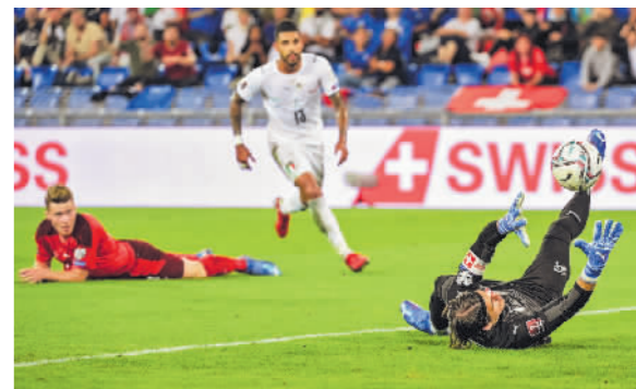
瑞士队守门员索默(右)在瑞士队和意大利队的比赛中扑救。