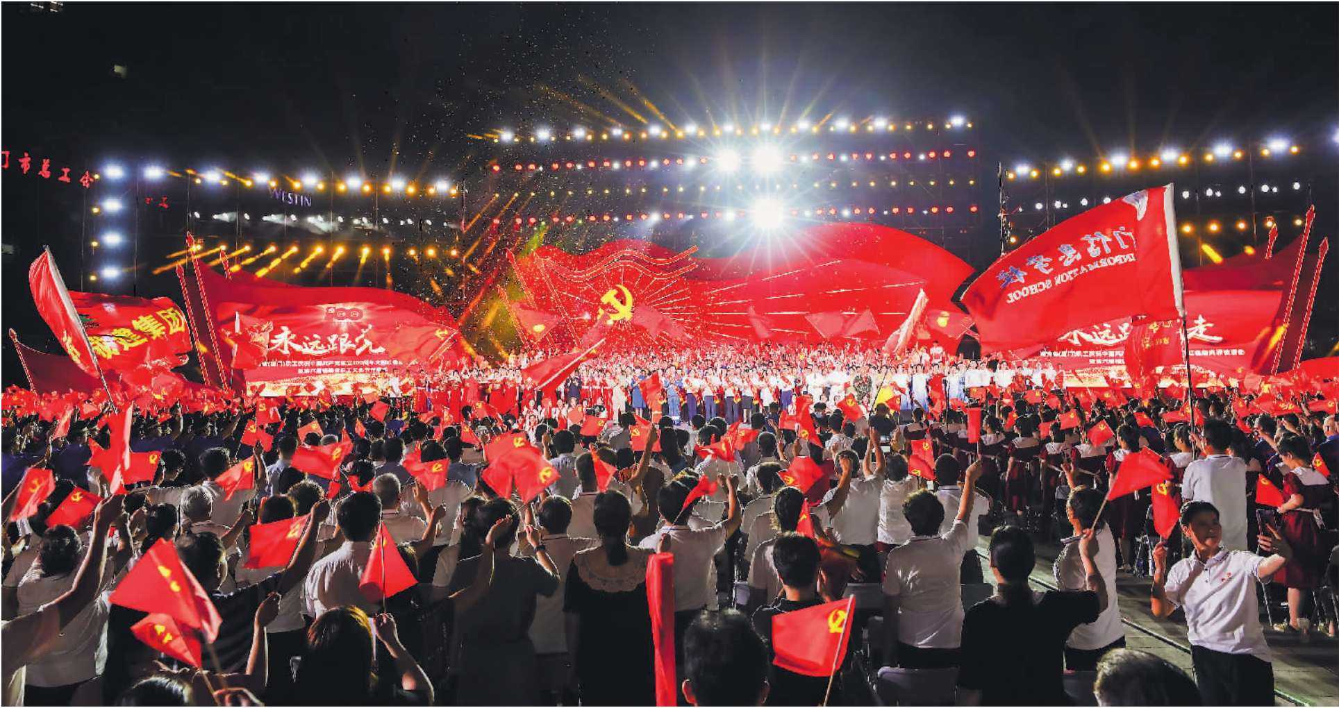
开展“永远跟党走——福建省（厦门）职工庆祝中国共产党成立100周年大型红色经典诵读”活动。