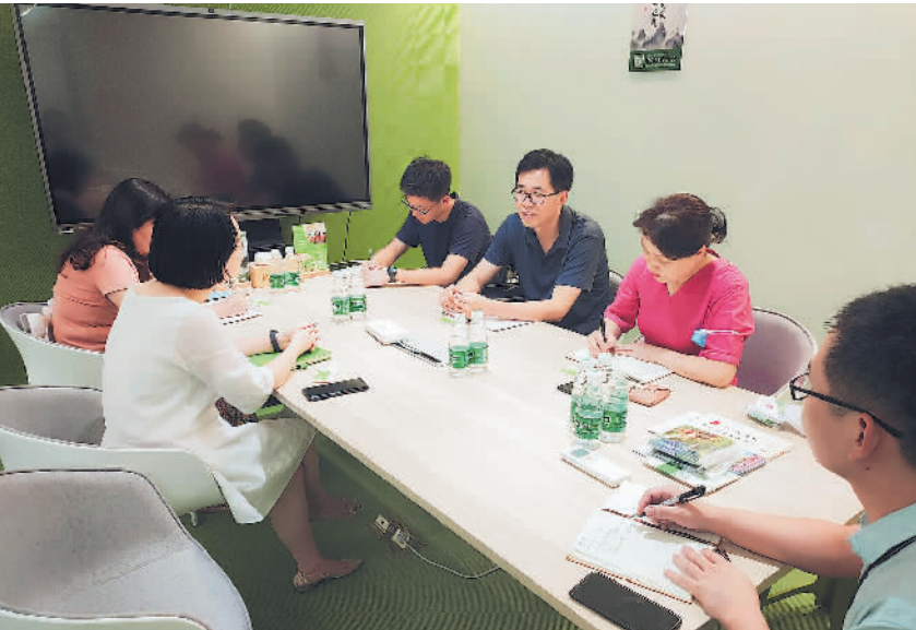
市总工会机关干部深入基层开展蹲点调研。

系和谐，为职工办实事解难事为主要任务，根据基层单位情况复杂、群体多元的特点，各蹲点组因地制宜，就家政行业招工难、入会难，小微企业对于工会政策了解不足、职工业余生活较为单一等问题，及时采取针对性举措，安排专人引导灵活就业群体主动依法入会、将共享职工之家引进企业、引进社区……让职工真正感受到工会是看得见、找得到、信得过、靠得住的“娘家人”。