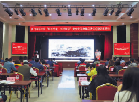
启动“职工学堂·工悦领学”党史学习教育。