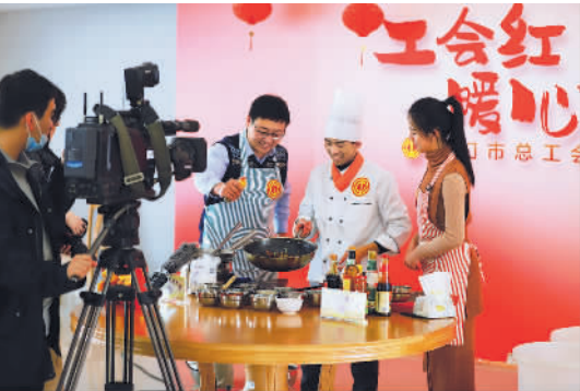
职工学堂开设线上直播，满足职工多元化培训需求。

厦门市总工会深入学习贯彻习近平总书记“七一”重要讲话精神、习近平总书记在党史学习教育动员大会上的重要讲话精神，持续在“学党史、悟思想、办实事、开新局”上下功夫，把党史学习教育同解决职工实际问题、推动工会工作紧密结合。压实主体责任，创新学习方式，聚焦职工所需，务求工作实效，高标准高质量推进党史学习教育深入开展，做服务职工的有心人。