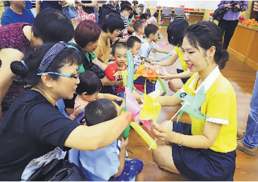
思明区嘉莲街道总工会打造全省首个招收低龄幼儿的暑托班。