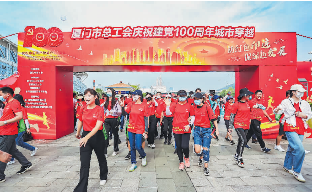
↓举办“访红色印迹 促绿色发展”厦门市总工会庆祝建党100周年城市穿越活动。

父母专场相亲会圆满举办，100名单身职工父母来到活动现场为子女寻找良缘。为满足在厦青年职工的交友需求，帮助职工解决婚恋问题，厦门市总工会以工会会员信息系统为依托，建立“工会红娘”数据库，以传统节日和重大活动为节点，开展“工会相亲角”。隔离不隔爱，工会服务不打烊。疫情期间，市总工会及时调整业务办理方式，举办线上交友活动，解决在厦单身职工“找对象”难题。目前累计举办9场联谊交友会。