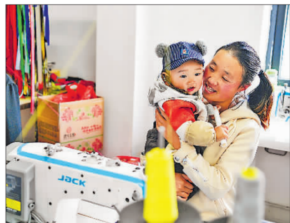
告别苦瘠 再启新程

会议研究决定,以湖北省政府名义印发《关于推动全省劳动和技能竞赛在更高水平上发挥更大作用的有效抓手,为全省劳动和技能竞赛深入开展指向赋能、营造氛围、提供政策保障。