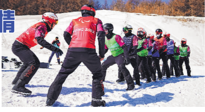
众冰雪体验项目，不断降低残疾人参与冰雪运动的门槛。第十届全国残疾人运动会还举办了旱地冰壶比赛，首次将残疾人大众冰雪项目纳入全国残运会。

长期以来，受残疾人身体条件限制，冰雪场地无障碍设施水平等因素影响，残疾人参与冰雪运动存在一定困难。为此，中国残联在推动无障碍环境建设的同时，组织推广了旱地冰壶等大