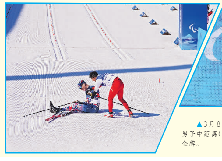
3月8日，在北京2022年冬残奥会冬季两项男子中距离(坐姿组)比赛中，中国选手刘梦涛获得金牌。

3月7日，在北京2022年冬残奥会越野滑雪男子长距离(传统技术-站姿组)比赛中，加拿大选手马克·阿伦兹冲过终点后趴在地上，已经通过终点的中国选手蔡佳云立即上前将他扶了起来。