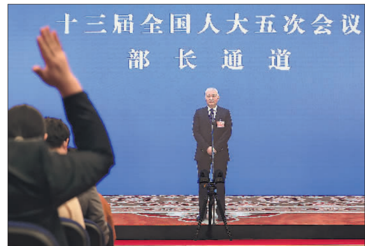
▲3月8日上午,“部长通道”再次开启,科技部部长王志刚通过网络视频方式接受采访。