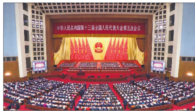
▲3月8日,十三届全国人大五次会议第二次全体会议召开。