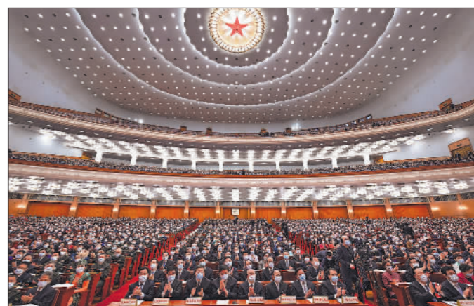
▲3月8日,十三届全国人大五次会议第二次全体会议召开。

▲3月5日上午,北京CBD,一位快递小哥从直播十三届全国人大五次会议开幕会的大屏幕前经过。今年的政府工作报告中提到:完善灵活就业社会保障政策,开展新就业形态职业伤害保障试点。坚决防止和纠正性别、年龄等就业歧视……众多举措体现民生期盼。