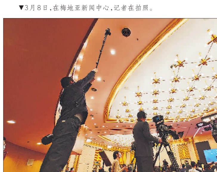
▼3月8日,在梅地亚新闻中心,记者在拍照。