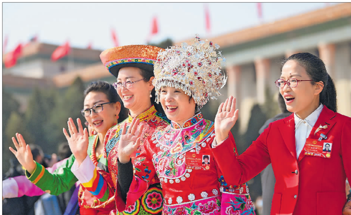
▲3月8日上午,十三届全国人大五次会议第二次全体会议结束后,几位女代表在人民大会堂前留影。苏思 摄