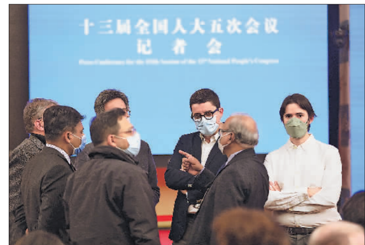
▲3月7日下午,参加两会采访的外国记者在记者会前一起交流。