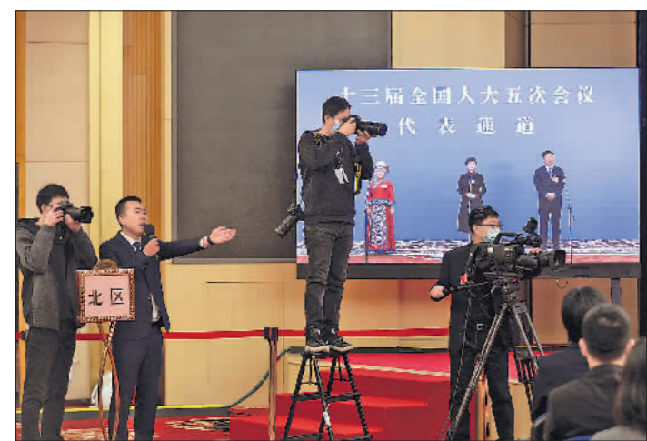
▲3月8日,记者采访第二场“代表通道”,来自基层一线的代表分享他们的基层故事。