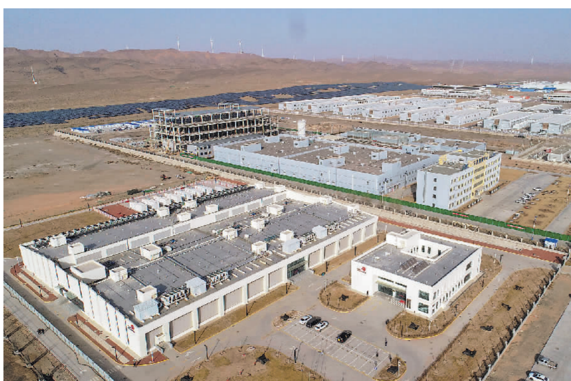
西部云基地全景(3月1日摄,无人机照片)。

今年,“苏适养老”综合评价指标体系将制定出台,民政部门还将开展养老服务状况抽样调查,制定基本养老服务制度实施意见,完善省市县基本养老服务清单,制定老年人能力综合评估实施细则,完善公办养老机构床位轮候公开登记制度,为促进基本养老服务均等化提供系统完备的制度支撑。