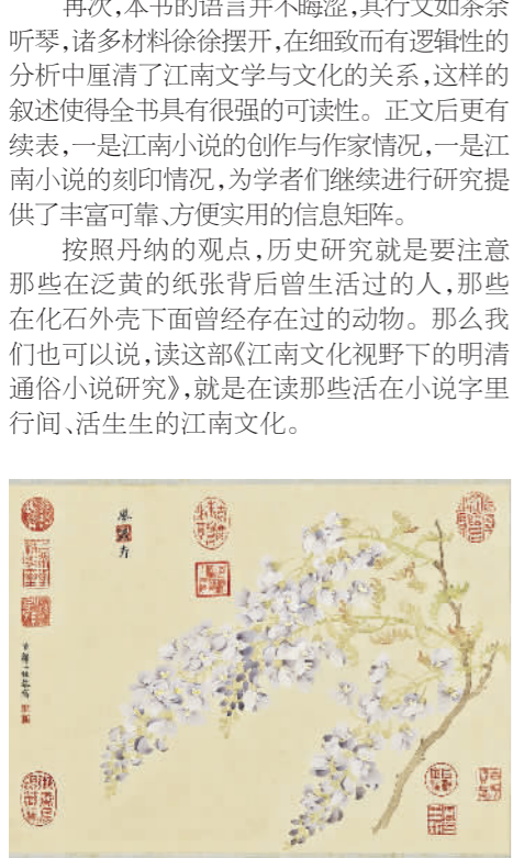
《藤花》 邹一桂 [清]

按照丹纳的观点,历史研究就是要注意那些在泛黄的纸张背后曾生活过的人,那些在化石外壳下面曾经存在过的动物。那么我们也可以说,读这部《江南文化视野下的明清通俗小说研究》,就是在读那些活在小说字里行间、活生生的江南文化。