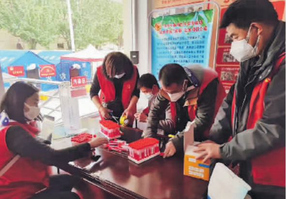
工会干部下沉社区志愿服务。