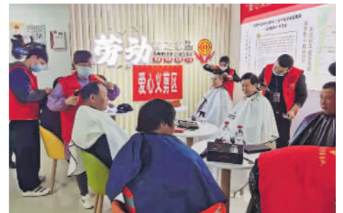
“爱心义剪”志愿服务。

“情暖职工”志愿服务行动暖人心。开展“工”字号志愿服务行动,累计参与志愿服务活动483人次,志愿服务时长4032小时。