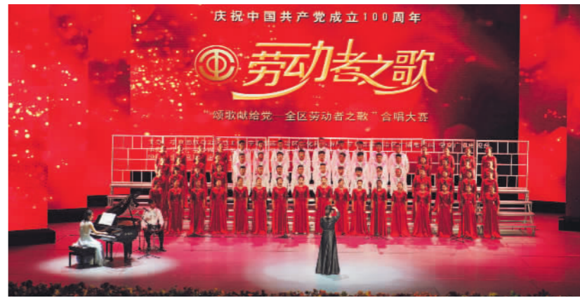
庆祝中国共产党成立100周年“颂歌献给党——全区劳动者之歌”合唱大赛。

2021年,是党和国家历史上具有里程碑意义的一年。在中国共产党百年华诞的喜庆氛围里,全国人民在党的领导下,迈着铿锵有力的步伐阔步向前。2021年,也是宁夏各级工会团结引领全区职工群众担当时代重任、奋力谱写发展新篇章的一年。一年来,宁夏各级工会坚持以习近平新时代中国特色社会主义思想为指导,深入贯彻落实党的十九大和十九届历次全会精神,以庆祝建党百年为主线,以党史学习教育为抓手,以服务经济社会高质量发展为使命,统筹推进各项工作,全区工运事业和工会工作实现了积极进展、取得了明显成效。