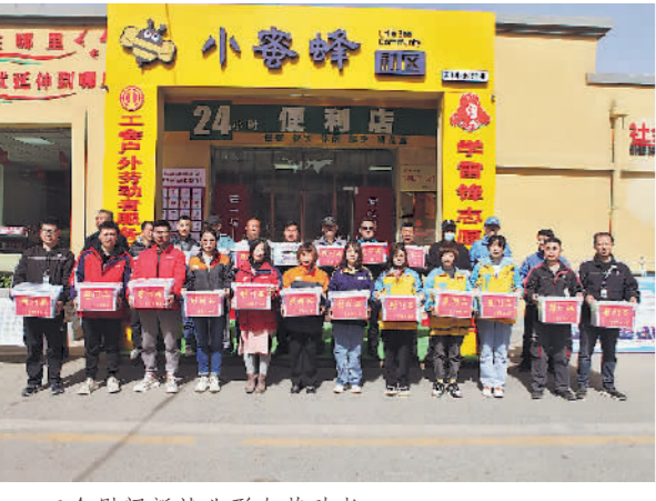
工会慰问新就业形态劳动者。