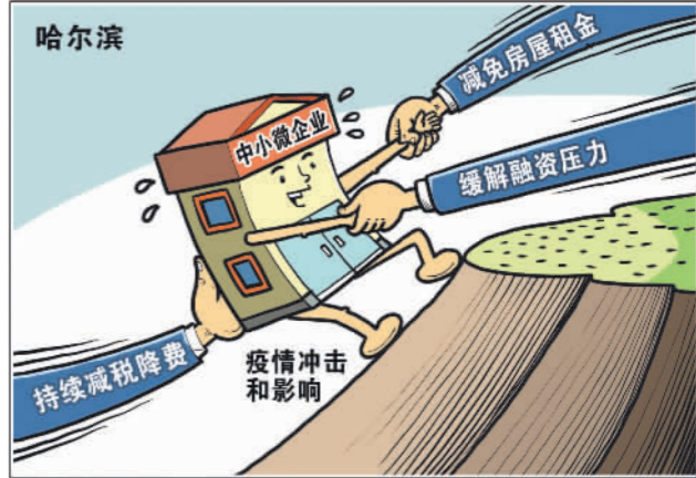
纾困解难 新华社发 朱慧卿作