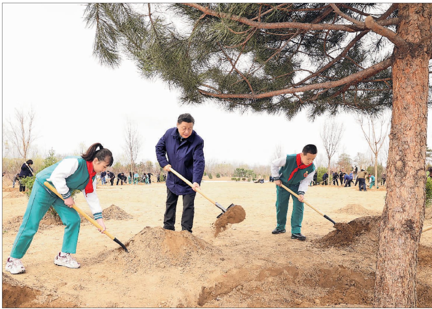
3月30日，党和国家领导人习近平、李克强、栗战书、汪洋、王沪宁、赵乐际、韩正、王岐山等来到北京市大兴区黄村镇参加首都义务植树活动。这是习近平同大家一起植树。

习近平指出，森林是水库、钱库、粮库，现在应该再加上一个“碳库”。森林和草原对国家生态安全具有基础性、战略性作用，林草兴则生态兴。现在，我国生态文明建设进入了实现生态环境改善由量变到质变的关键时期。我们要坚定不移贯彻新发展理念，坚定