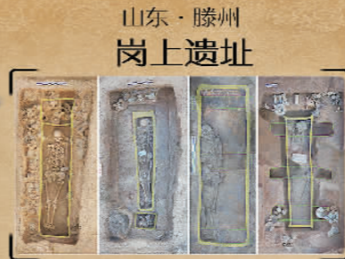
山东·滕州岗上遗址