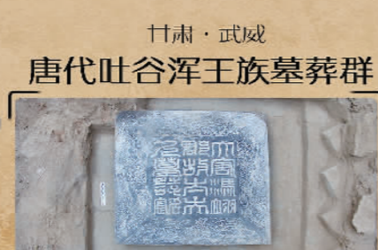
甘肃·武威唐代吐谷浑王族墓葬群