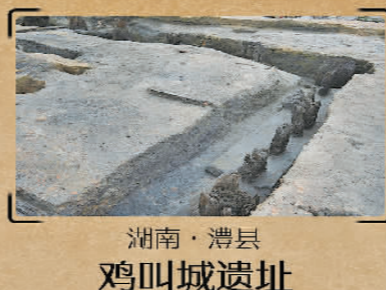
湖南·澧县鸡叫城遗址