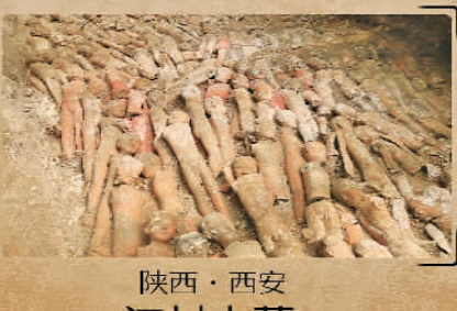
陕西·西安江村大墓