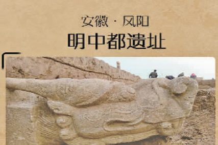
安徽·凤阳明中都遗址