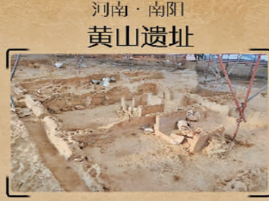
河南·南阳黄山遗址