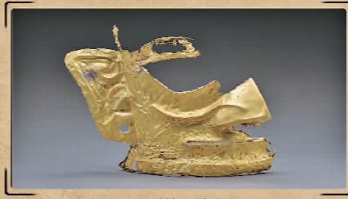
四川·广汉三星堆遗址祭祀区

本次评选由中国文物报社、中国考古学会主办。入选项目是我国早期人类起源、史前文化与中华文明发展、统一多民族国家历史进程的生动诠释,展现了绚丽多彩、源远流长、博大精深的中华文明风采。