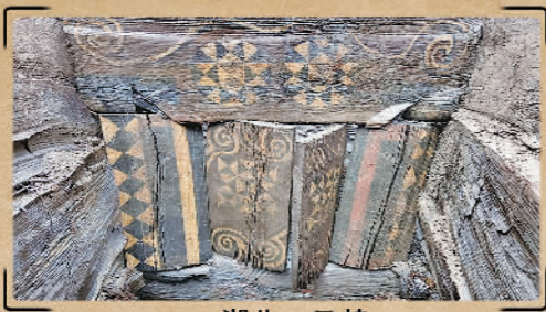
湖北·云梦郑家湖墓地

本报讯(记者苏墨)近日记者获悉,四川稻城皮洛遗址、河南南阳黄山遗址、湖南澧县鸡叫城遗址、山东滕州岗上遗址、四川广汉三星堆遗址祭祀区、湖北云梦郑家湖墓地、陕西西安江村大墓、甘肃武威唐代吐谷浑王族墓葬群、新疆尉犁克亚克库都克烽燧遗址、安徽凤阳明中都遗址等十个项目入选2021年度全国十大考古新发现。