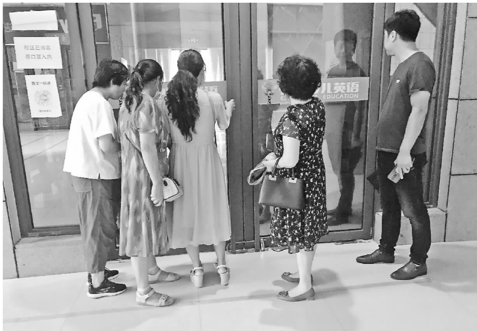
2021年7月的一天,西安一家少儿英语机构本该正常上课,但机构大门紧锁,所有工作人员“失联”。

来,十年前出台的《管理办法》已无法适应如今市场经济的发展。比如,《管理办法》没有涵盖教育、旅游、健身类企业和个体工商户,这就让目前一大批推行预付款消费的经营者游离于规制之外。再加上相关监管部门权责未清晰界定,最终导致消费者投诉无门。