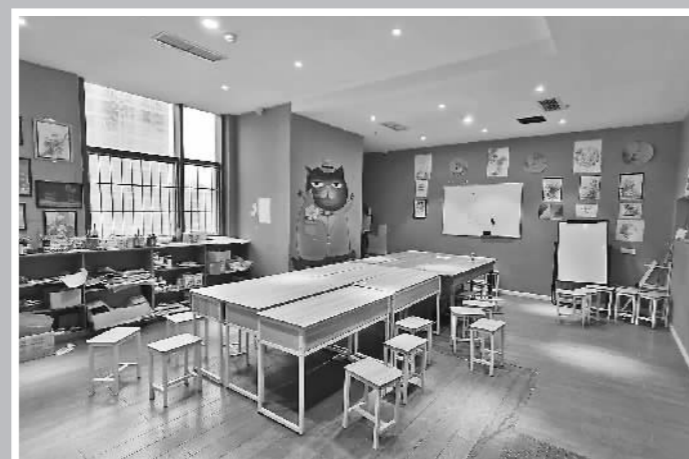
“金鹿角”的培训场所和桌椅都是租赁的,没有可供执行的财产。

“金鹿角”一案后,重庆市消委会逐步在全市范围内推广《支持消费者集体诉讼工作导则》,但在实施过程中遇到了部分区县法院拒绝消委会代表以“支持起诉人”身份出庭以及有的消委会因不作为不愿参与诉讼过程等问题。就此,今年3月,重庆市高级人民法院、重庆市消委会联合印发了《关于建立消费纠纷诉源治理工作机制的实施意见》,强调要积极探索消费者集体诉讼制度,明确消委会可通过在庭审中协助举证、发表观点等方式支持当事人诉讼,人民法院应充分听取消委会的支持起诉意见,依法、公正、及时地维护众多消费者的合法权益。