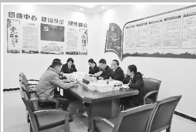
重庆市消委会相关人员在研究支持“金鹿角”一案受害家长提起集体诉讼相关事宜。